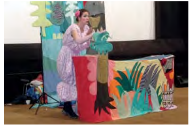
Divadlo JAJA – predstavenie Hlúpe kura.