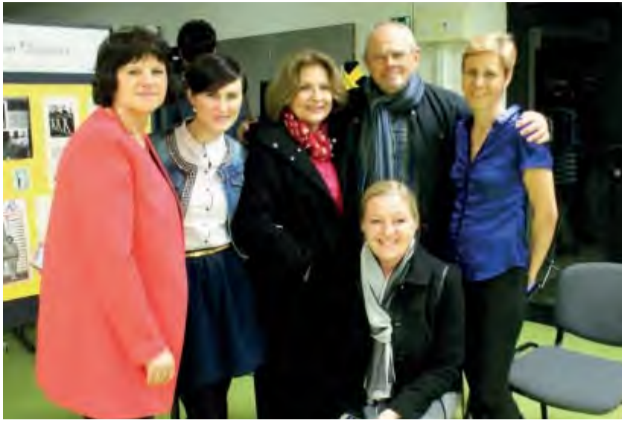
Priateľská atmosféra po divadelnom predstavení Klamstvo.