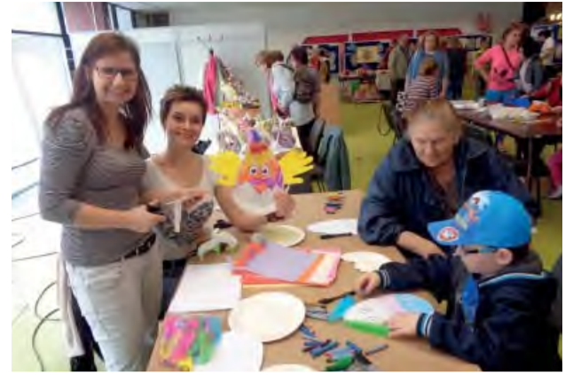
Deti si s nadšením ručne vyrábali svoje veľkonočné ozdoby.