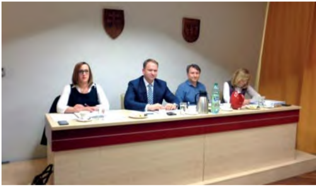
Vedenie mesta na aprilovom MsZ.

Dňa 12. apríla sa v priestoroch Kultúrnej besedy konalo mestské zastupiteľstvo. Poslanci prerokovali spolu 18 bodov schváleného programu.