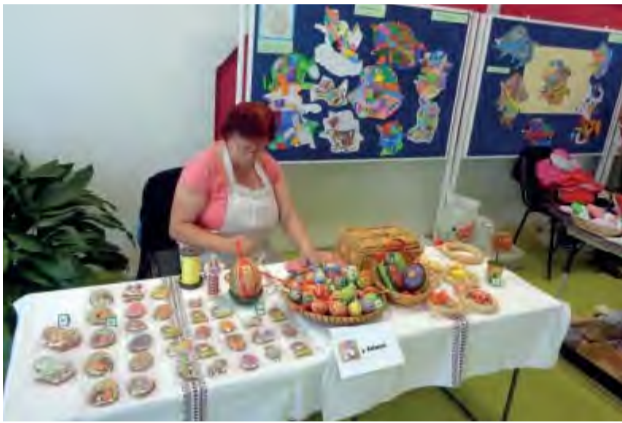
Remeselníkov z blízkeho okolia sa zišlo tento rok mnoho.