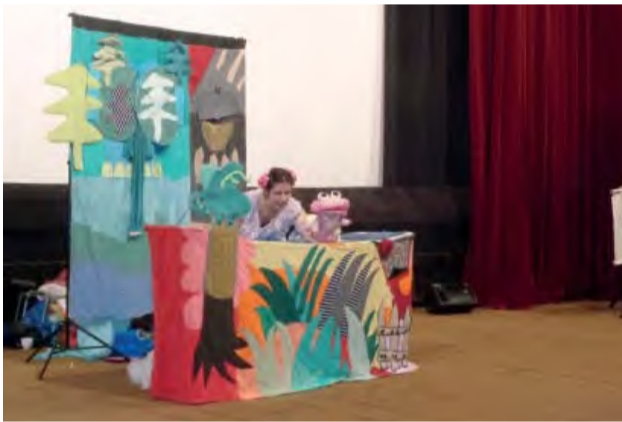
Prečo húseničky v zime spinkajú sa deti dozvedeli veľmi zábavnou formou.