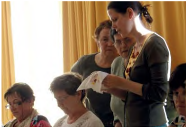
V Kultúrnej besede sa 1. apríla vyšívalo – prvky z Krohovej architektúry.