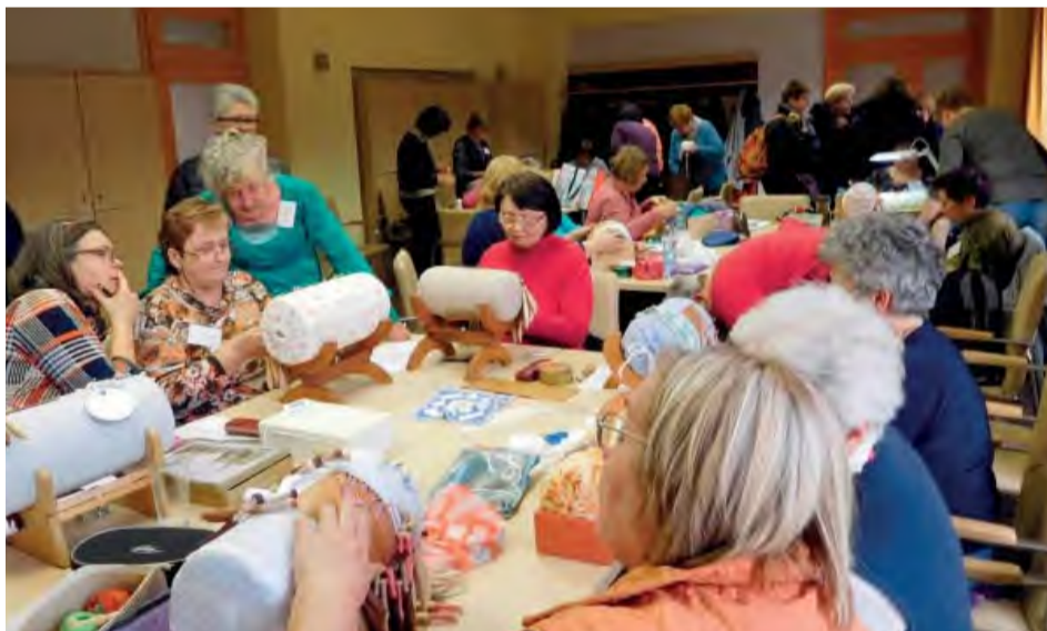
Zraz čipkárok z celého Slovenska.

Kultúrna beseda v Novej Dubnici v dňoch 17. - 19. marca ožila klepotom paličiek. Čipkáčky prišli do Novej Dubnice zo všetkých kútov Slovenska, od Prešova po Bratislavu, od Tatier po Dunaj, aby si osvojili základy paličkovačia čipky zo Španej Doliny.