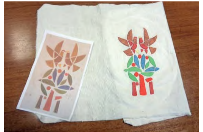
Všetky vyšité výrobky budú použité ako reprezentačné predmety pre návštevníkov nášho mesta pri príležitosti 60. výročia mesta.