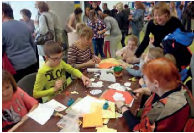
Velkonočné tvorivé dielne v kine Panorex .