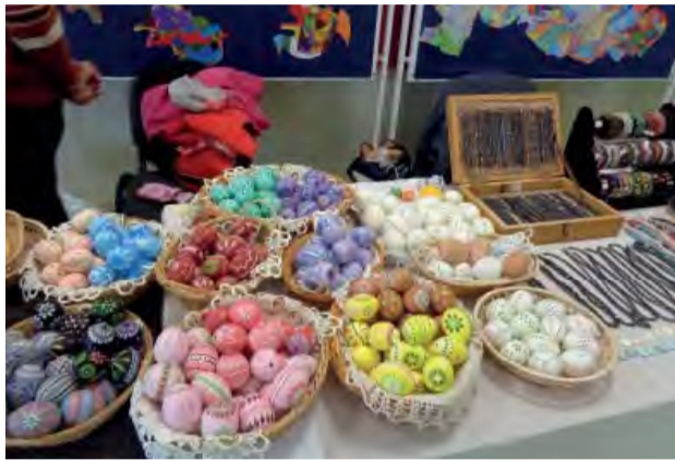
Nádherné ručne malované vajíčka, či zdobení zajačikovia, bolo z čoho vyberať...