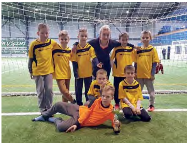
Malí prípravkári U8 na turnaji v Komi.

Vážení športoví priatelia, dňa 19. 3. 2017 sa naši malí prípravkári U8 zúčastnili na medzinárodnom turnaji v Komi.