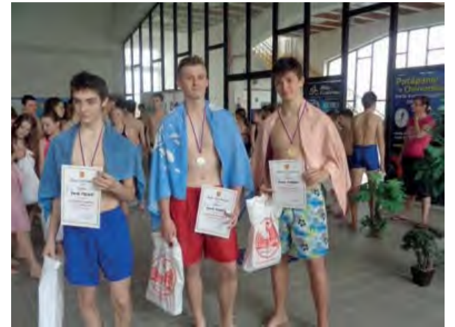
Víťazi plaveckých pretekov.