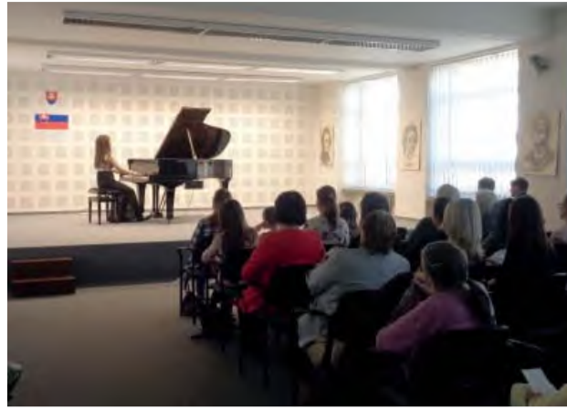
Koncert ku Dňu učiteľov sa vydaril.

Deň učiteľov sa oslavuje v deň narodenia pedagóga Jána Ámosa Komenského, učiteľa národov. Sviatok je oslavou práce všetkých pe-