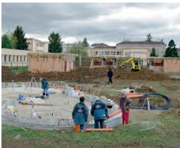
Budúci detský bazén a priestory určené na občerstvenie.