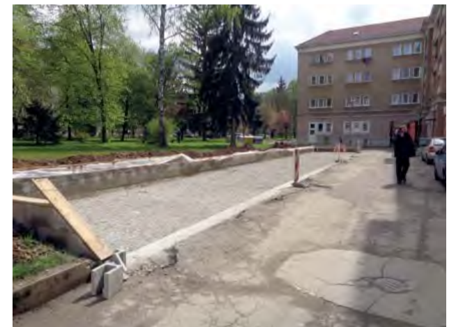
Nové parkovisko na Ulici Pribinove sady.

S príchodom jari mestská spoločnosť TEKOS začala aj so stavebnými prácami.