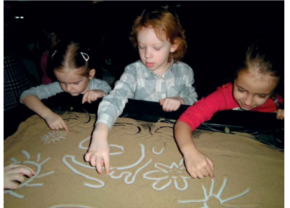
Práca s pieskom bola pre deti naozaj zaujímavá.

Piesočná animácia je kreslenie pomocou jemného piesku, z ktorého sa dá vytvoriť akýkoľvek obraz, príbeh, a ten živo nakreslíť pred publikom a cez projekciu preniesť na interaktívnu tabuľu.