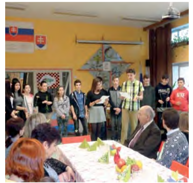
Žiaci príjemne prekvapili svojich učiteľov.