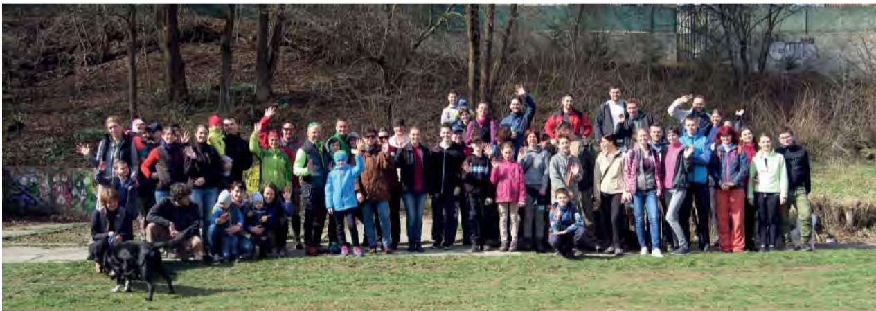
Množstvo ľudí sa zapojilo do akcie Vyčistíme si les 2017.

Keď sa povie, idem do lesa zbierať odpad, málokto si predstaví, koľko si tam užijeme zábavy. A to nepreháňam.