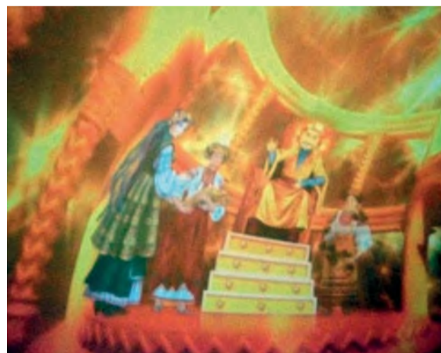
Sférické kino sa postaralo o nevšedný zážitok.

Výnimočný deň, s výnimočným programom. Ako sme sa všetci tešili. Veď v tento deň sme mali veľký zážitok. Sférický projekčný systém vnútri pojazdnej kupoly v našej materskej škole.