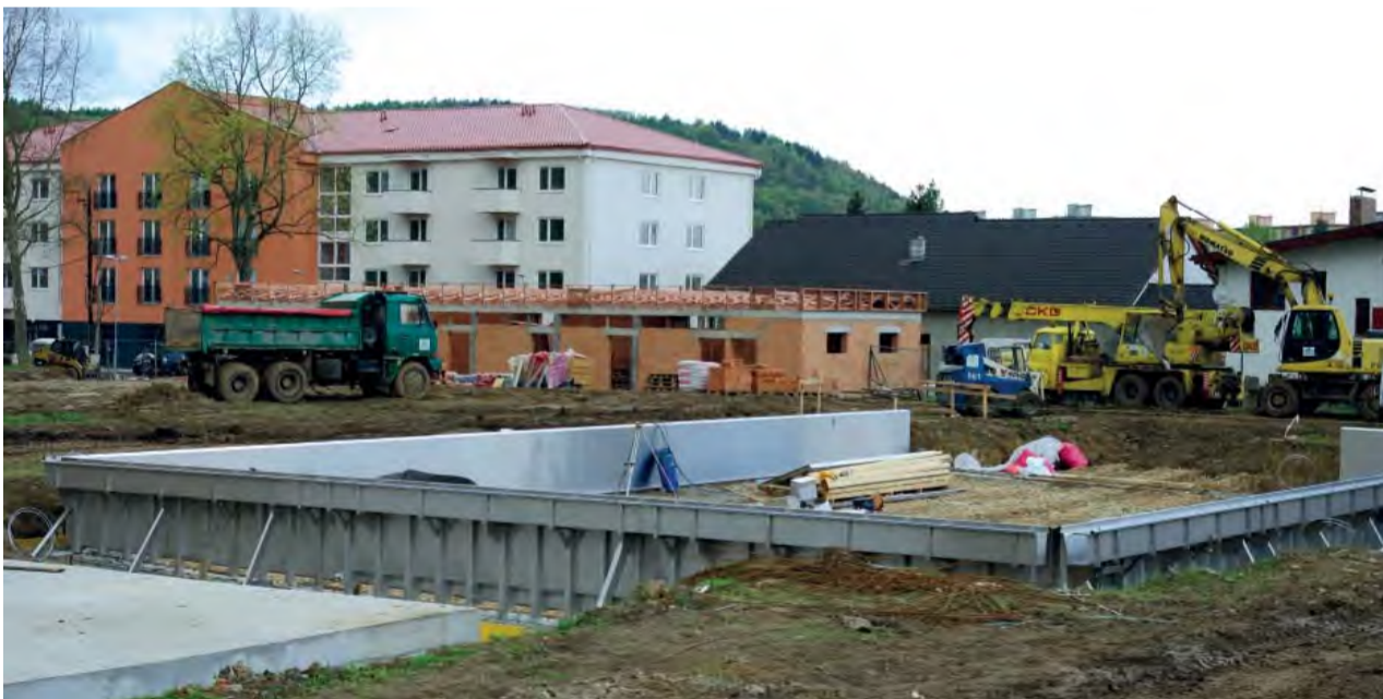
Konštrukcia nového plaveckého bazéna a vstupné priestory na kúpalisko so sociálnym zázemím.

Dňa 13. apríla 2017 ubehli presne dva mesiace od odovzdania staveniska letného kúpaliska zhotoviteľovi.