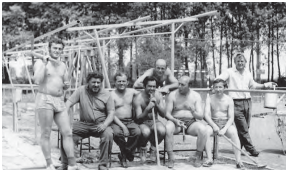
Výstavba hádzanárskej šatne v roku 1973.

V ďalších vydaniach NDZ sa dočítate o jednotlivých druhoch športov. Preto radi privítame svedectvá, spomienky, fotografie a iné materiály od občanov – hlásiť sa môžete na oddelení kultúry a športu na MsÚ, poprípade na tel. čísle 0911 263 380.