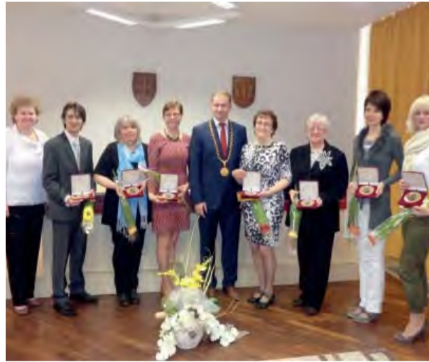
V Kultúrnej besede sa oceňovalo.