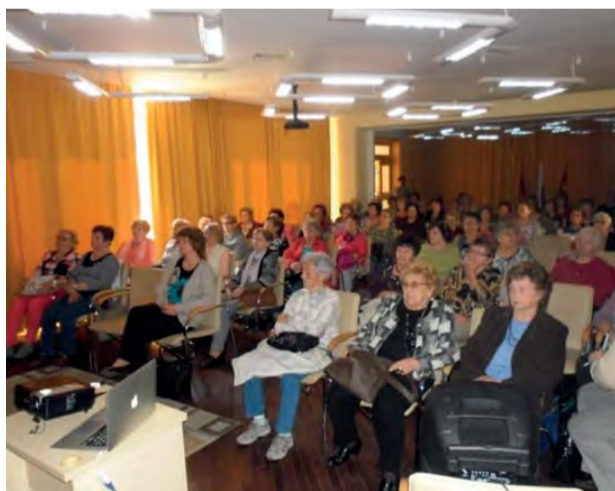
Množstvo seniorov sa zišlo na prednáške.