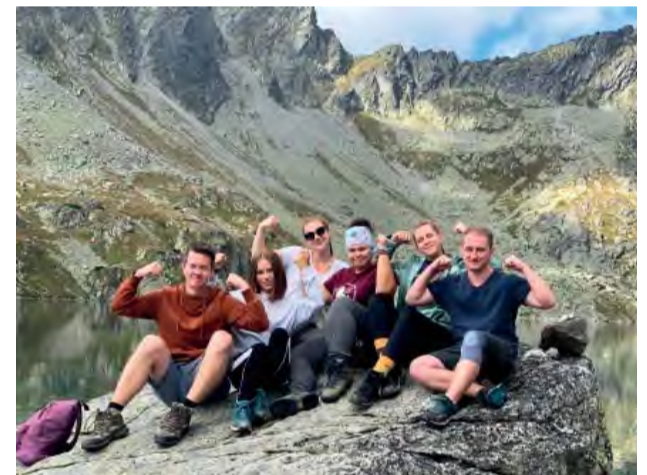
Partia starších animátorov obdivovala nádhery našich veľhôr.

ždoročné duchovné cvičenia. Tentoraz okrem iného uvažovali na tému „láska“, vychádzajúc z biblických textov knihy Pieseň piesní a prvého listu svätého apoštola Pavla Korinťanom, konkrétne o slávnom Hymne na lásku.