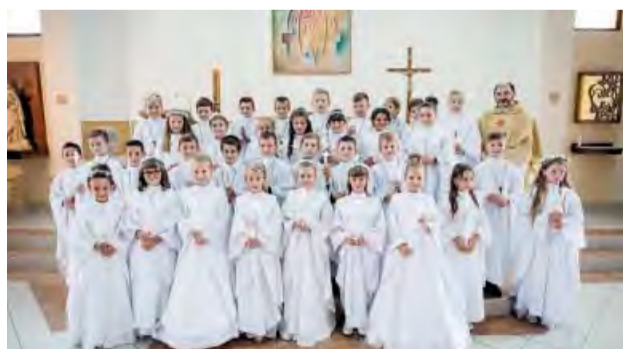
Deti zo Spojenej školy sv. J. Bosca počas svojho veľkého dňa.

V sobotu 26. septembra sa v Kostole sv. Jozefa Robotníka uskutočnila odložená