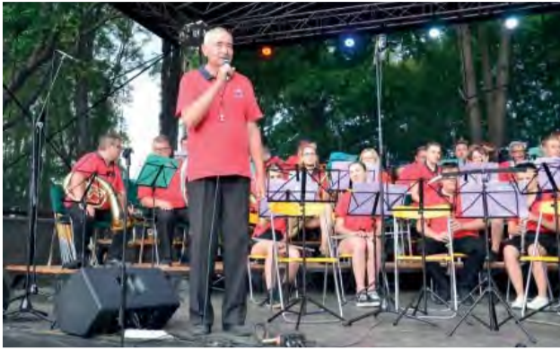
Účinkovanie orchestra na festivale dychových orchestrov v Dolnom Benešove.

V našom meste ešte stále nacvičuje novodubnický dychový orchester a mažoretky. Naposledy sme mali príležitosť zahráť si na verejnosti pri príležitosti fašiangového sprievodu mestom a fašiangovej oslavy v priestoroch Amfik Pubu.