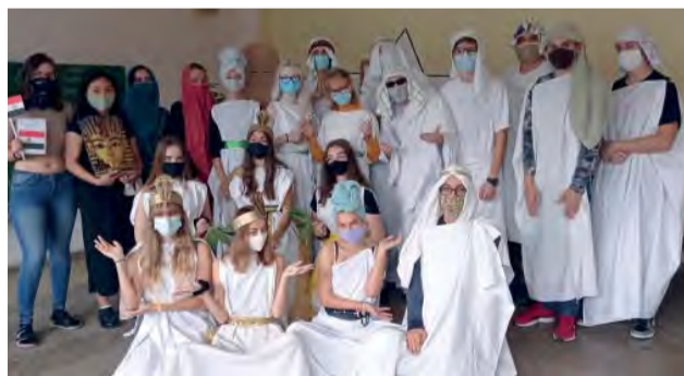
Uhádnete, z ktorého štátu prichádzame?