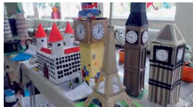
Krásne modely pamiatok, ktoré charakterizujú jednotlivé krajiny.

V priebehu dopoludnia sme sa mohli ocitnúť vo Fínsku a obdivovať polárnu žiaru, zahráli sme si hokej v Kanade, ochutnali vynikajúce tradičné jedlá všetkých krajín, zatancovali si írsky národný tanec, stretli vlka a zajaca v Rusku, ponorili sa do histórie Švédska a nakoniec sme sa ocitli medzi pyramídami v starovekom Egypte, stretli sme Kleopatru a Tutanchamóna.