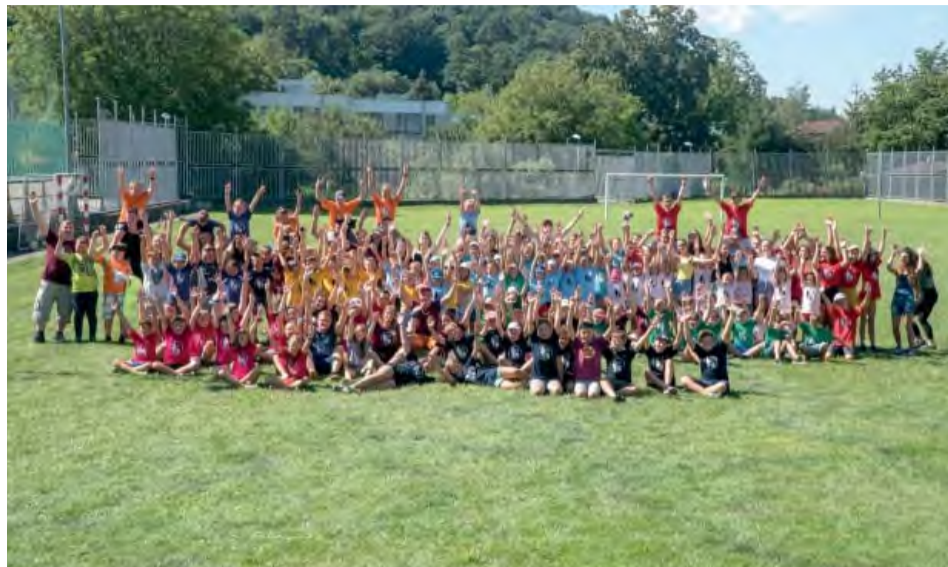
Napriek obmedzeniam sme prázdniny využili naplno.

Aj tento mimoriadny „koronový“ rok sme počas leta v novodubnickom Saleziánskom oratóriu – mládežníckom stredisku, pripravili pre deti a mládež tradičné podujatia.