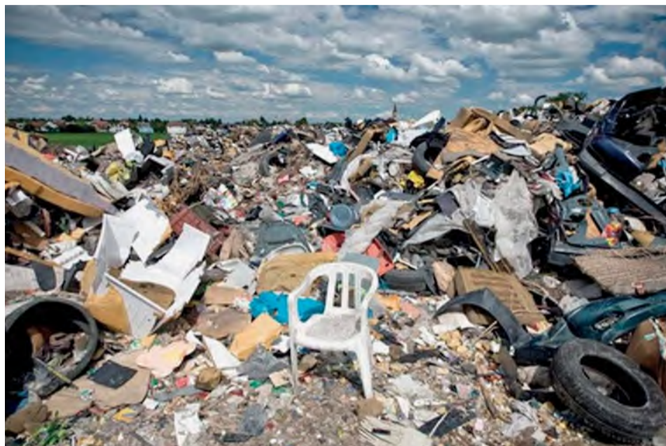
Až polovica odpadov uložených na skládku môže byť využitá.

Mám problém, veľký. Je mi záhadou, že v dnešnej dobe, keď už vďaka televízii, časopisom o životnom štýle, Adele Vinczeovej a fejsbúku (a teda v poslednom rade aj povinnosťou uvedenou v zákone) je TRIEDIŤ ODPAD moderné, „IN“, slušné, zodpovedné a správne a dokonca zlepšujúce karmu, sa nájdu osoby, ktorým je to ale že úplne šumafuk.