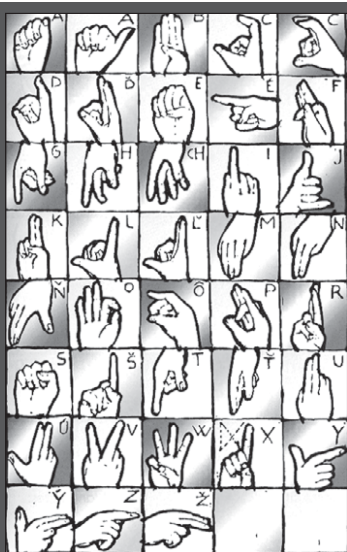
Slovenská prstová abeceda.