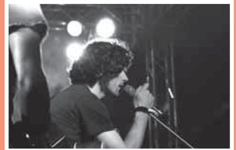
Chutný Puding pani Elvisovej. ...a publikum sa pomaly dostávalo do varu.