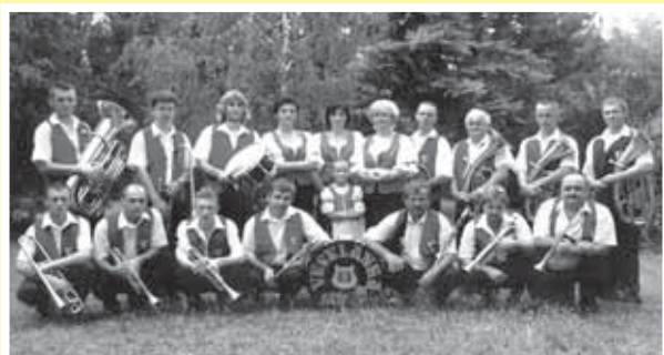
Jedna z troch najstarších na Slovensku DYCHOVÁ HUDBA VESELANKA 3. august 16.30 hod. - Mierové námestie

Prvé písomné zmienky o Veselanke sa dochovali ešte z roku 1851, čím sa zaraďuje medzi tri historicky najstaršie dychové hudby na Slovensku. Pôsobí v obci Veselé cca 10 kilometrov od Piešťan. Ako uvádzajú samotní členovia orchestra, sú hrdí na to, že pochádzajú z rovnakej obce ako prvý predseda Matice slovenskej Dr. Štefan Moyses.