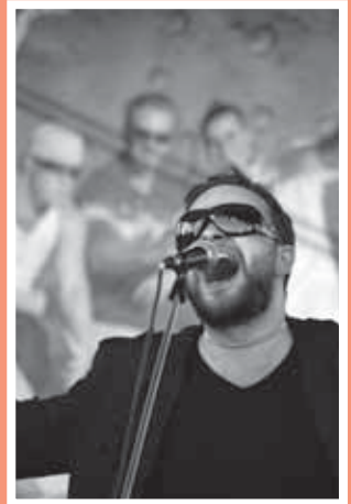
Ears hrali pri západe slnka. Nad amfikom sa vznášal magický opar...