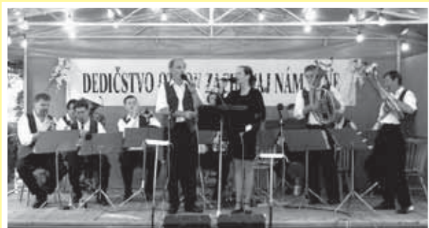
Tlieskala im západná Európa, aj Senzus DYCHOVÁ HUDBA LIESKOVANÉ 10. august 16.30 hod. - Kultúrny dom Kolačín

Názov tejto dychovej hudby dala obec, v ktorej pôsobí, Moravské Lieskové. Dychovka tu má dlhodobú tradíciu a práve na ňu nadviazali Lieskované v roku 1989. Repertoár tvoria spievané ľudové a novovytvorené pesničky. Dychová hudba sa pravidelne prezentuje v rozhlase a televízii, napr. v reláciách Zahrajte mi takúto, Senzi Senzus, Anderov rebriňák, Záhorácka búda.