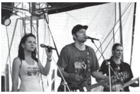
Štartéri Smola a hrušky - smolu, našťastie, nepriviezli. Meškanie začiatku sme časom dohnali.