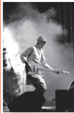
Bezprostrední a recesistickí Chiki líki líki tu-a ako parádna bodka.