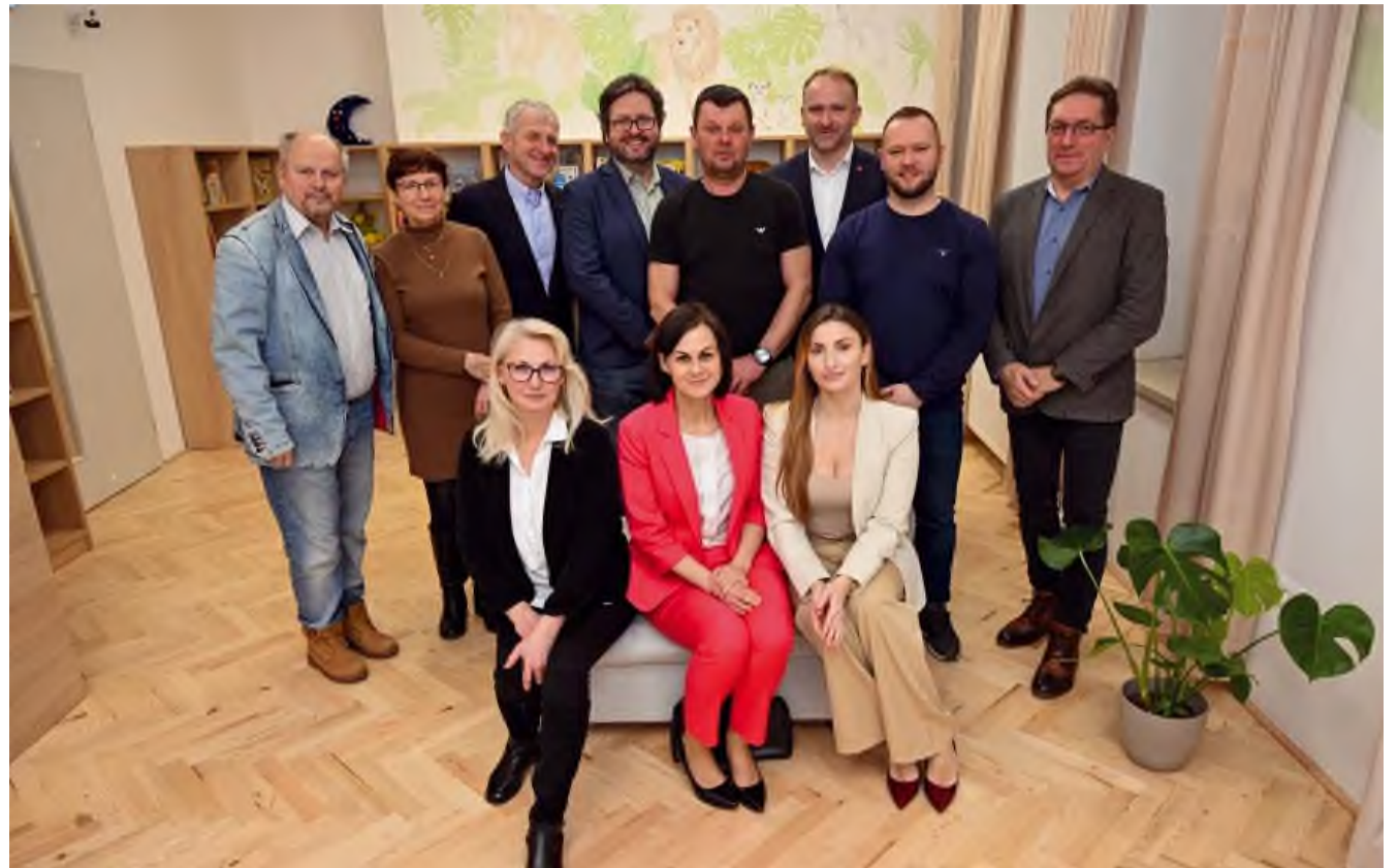
Vďaka tímovej práci sa z knižnice stalo moderné a útulné miesto.