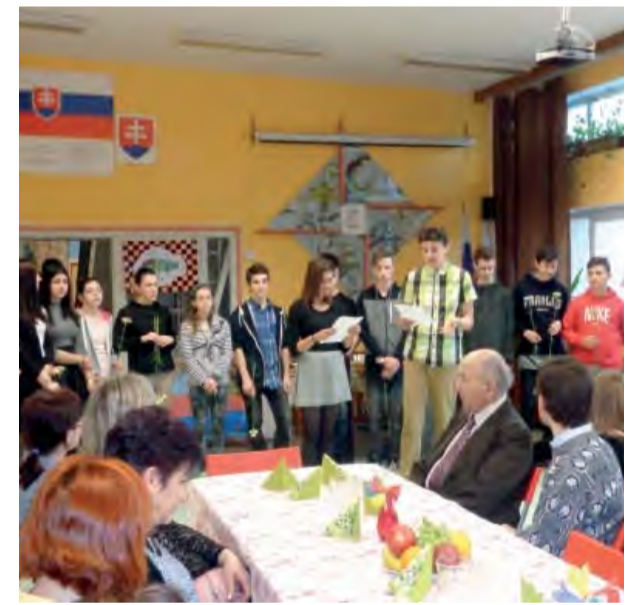
Žiaci príjemne prekvapili svojich učiteľov.