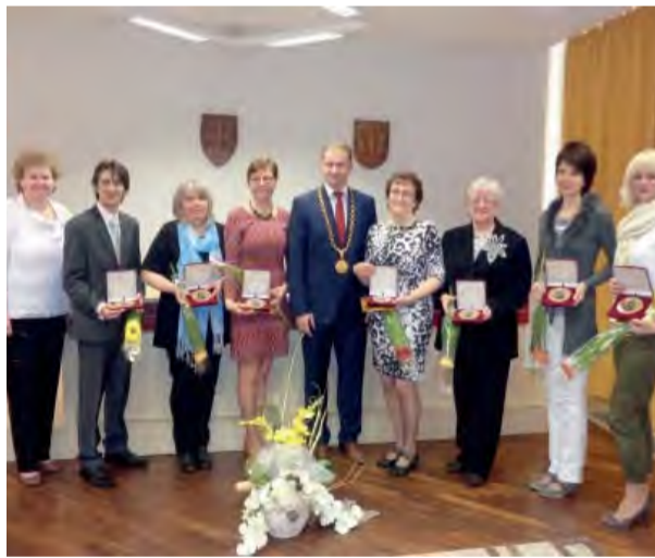
V Kultúrnej besede sa oceňovalo.