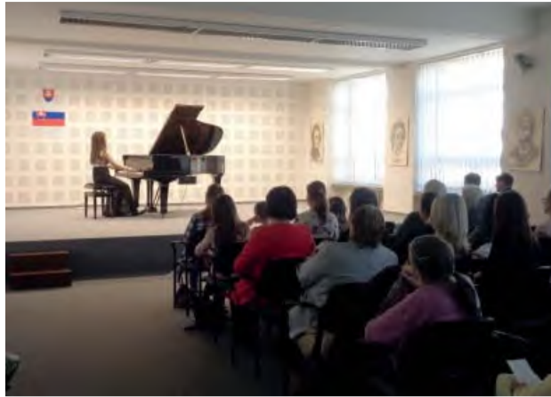
Koncert ku Dňu učiteľov sa vydaril.

Deň učiteľov sa oslavuje v deň narodenia pedagóga Jána Ámosa Komenského, učiteľa národov. Sviatok je oslavou práce všetkých pe-