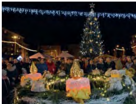
Sviatočná atmosféra na Mierovom námestí, po zapálení 2. adventnej sviečky.