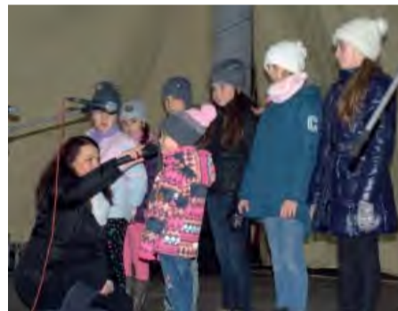
Bohatý program si pripravili aj žiaci ZŠ Janka Kráľa.