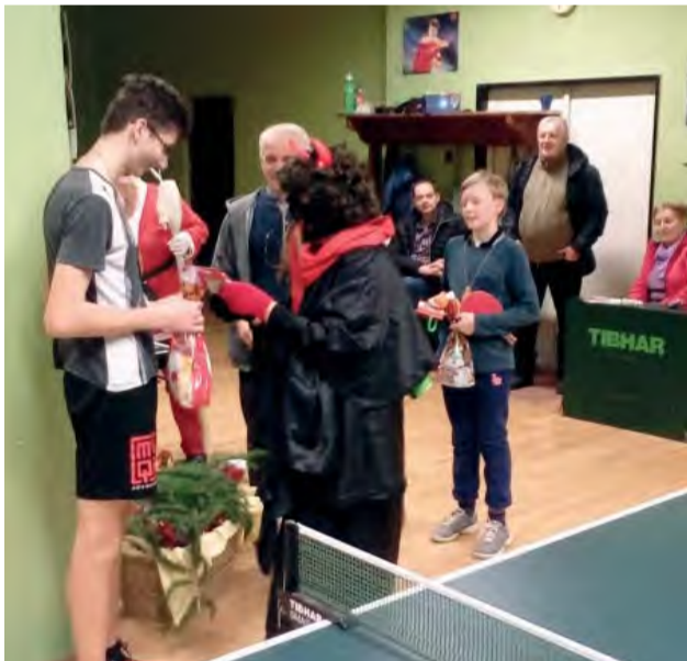
Vyhlasovanie víťazov v rézii Mikuláša a čerta.

MKST v spolupráci s oddelením kultúry a športu MsÚ zorganizovali tradičný stolnotenový turnaj pre školskú mládež mesta.