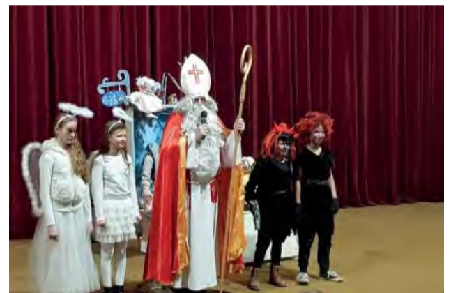
...a po predstavení prišiel medzi deti Mikuláš v sprievode anjelov a malých čertíkov.