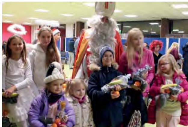
Vďaka štedrým sponzorom si všetky deti odnášali plnú náruč darčiekov.