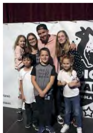
Šťastní trenéri so svojimi zverencami.