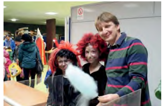
Sladké prekvapenie od firmy SWAN.

Ďakujeme všetkým sponzorom: Kaufland Ilava, Tesco Nová Dubnica, Aquatec Dubnica, Megawaste Slovakia, Party partners, JKC Trenčín, Hračkárstvo Luljakovci.