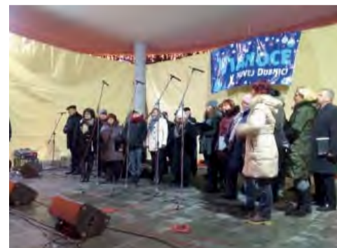
V úvodnom programe sa predstavil Miešaný spevácky zbor Nová Dubnica.