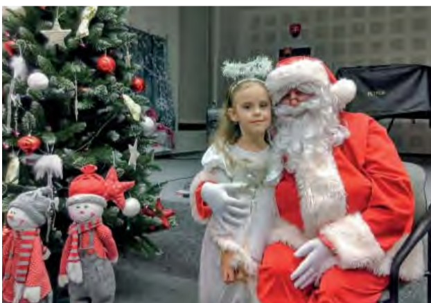
Niet nad úprimnú detskú radosť.

Dňa 5. 12. zavítal do Centra voľného času Mikuláš. A neprišiel sám. Tento rok zobral so sebou i čerta a dvoch anjelikov. Mánušky Janko a Marienka prezradili deťom, že o chvíľu nastane najkrajšie sviatky roka – VIANOCE, no ešte predtým príde Mikuláš.