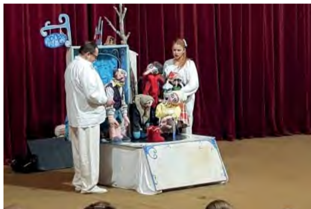
Úvod patril Divadlu pod balkónom s rozprávkou Neobyčajné dobrodružstvo obuvníka Jakuba.