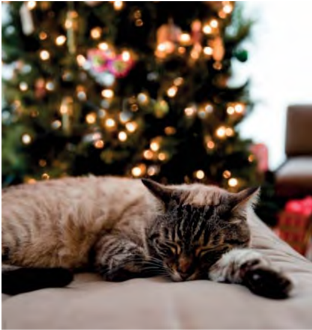
Vianočná nálada sa týka všetkých členov domácností.

Od dievčat z kultúry som dostala za úlohu v tomto predvianočnom čase nemovalizovať nad environmentálne závažnými problémami, nepoučovať o dôslednom triedení odpadov, ale naladiť sa na vianočnú nótu a prispieť článkom povzbudivým, v zime zahrejúcim.