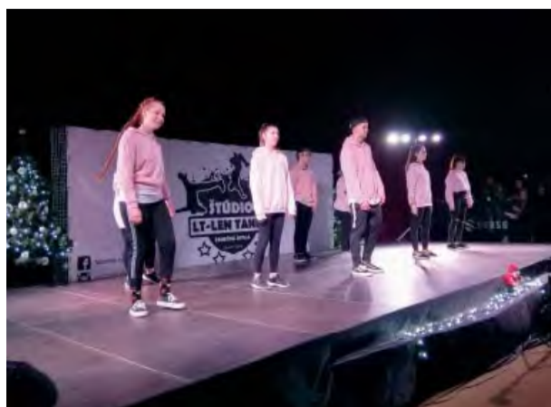
Celý program mal úžasnú atmosféru a bol do detailu prepracovaný.