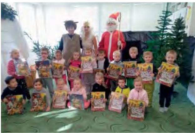
Deti sa radovali z adventných kalendárov.