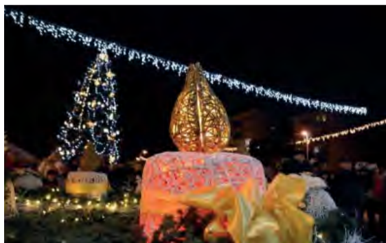
Prvá sviečka na adventnom venci zapálená.