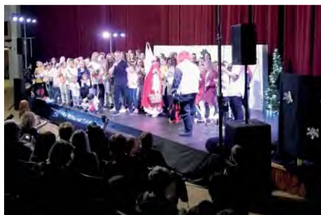
Skvelý výkon všetkých účinkujúcich - sme na vás pyšní!