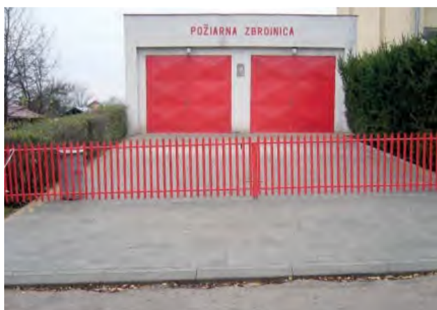
Požiarňa zbrojnica v Kolačine pred rekonštrukciou. Po ukončení bude ponúkať viac možností pre členov.