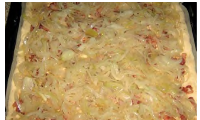
Cibulový koláč podľa receptu Evy Vetrovej.