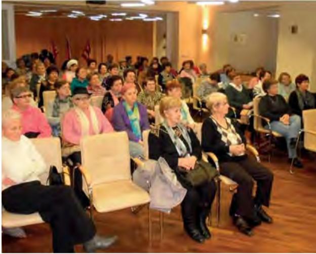
Zaujímavá prednáška pre členov ZO JDS Nová Dubnica.

Jednota dôchodcov na Slovensku si na rok 2017 stanovila nasledovné priority: Integrovaná sociálna a zdravotná starostlivosť / Prírodné rodinné prostredie / Preventívne zdravotné prehliadky / Lieková politika a alternatívne lieky / Starostlivosť o početnú skupinu seniorov pod hranicou chudoby / Zvyšovanie osvetu formou vzdelávacej činnosti.