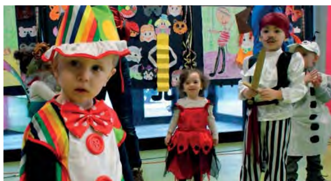
Porota to mala tento rok naozaj ťažké, aby vybrala tú najkrajšiu masku.