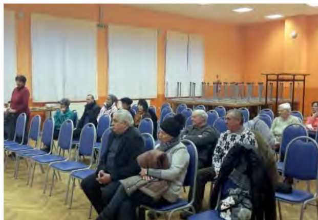
Obyvatelia Kolačina na diskusii so zástupcami mesta.