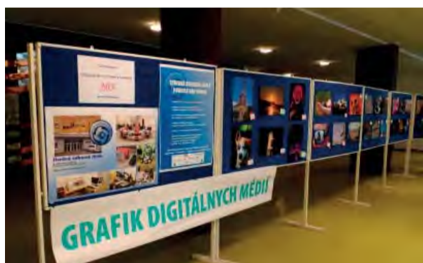
Zaujímavé fotografie žiakov SOŠ z odboru Grafik digitálnych médií.