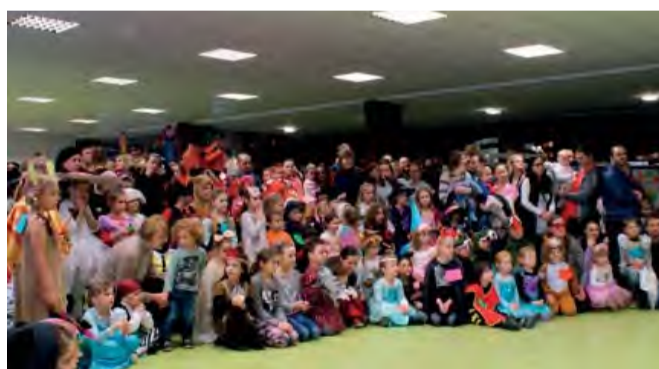
Detský karneval v kine Panorex.