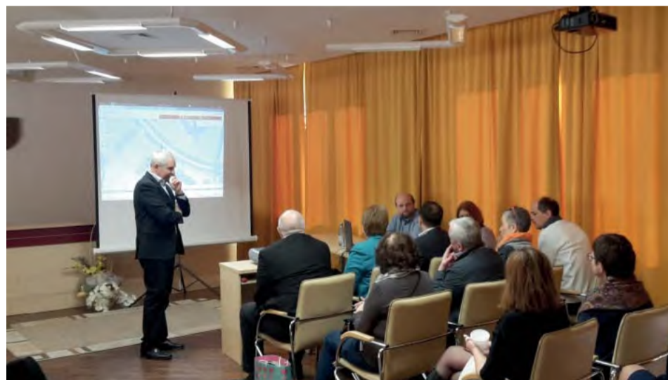
Prezentácia spoločnosti ErasData-Pro, s.r.o. v Kultúrnej besede.