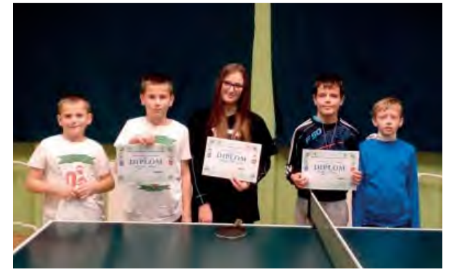
Víťazi stolnotenisového turnaja v žiackej kategórii.

MKST Nová Dubnica, v spolupráci s MsÚ Nová Dubnica, usporiadal v pondelok 26. 12. 2016 v stolnotenisovej hriani Domu športu (pri ZUŠ-ke) XVIII. ročník tradičného Vianočného stolnotenisového turnaja neregistrovaných hráčov (dospelí, mládež).