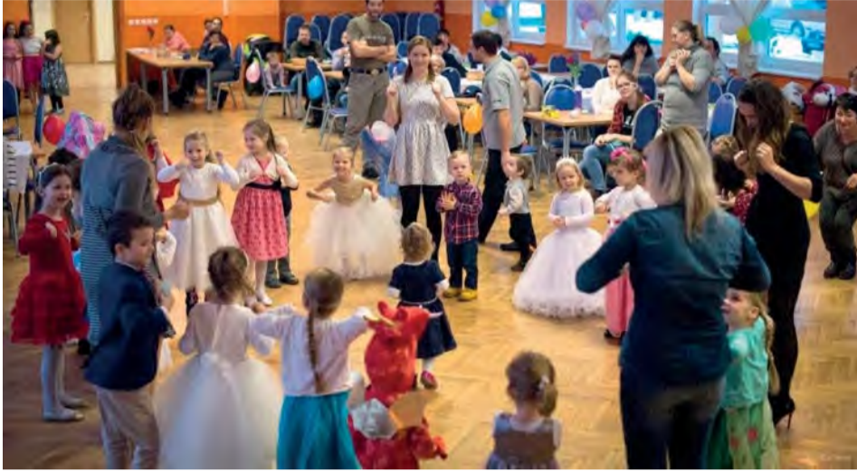
Deti z MC Ovečkovo sa na plese poriadne vyšantili.