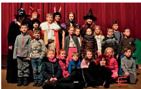
Dvaja tovariši - odfoťiť sa s kráľom či čertom chceli všetky deti.