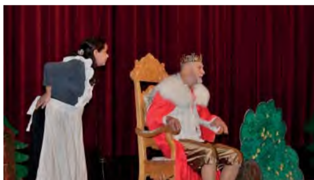
Dubnický divadelný súbor Oskar zabavil deti z MŠ a ZŠ rozprávkou Dvaja tovariši.