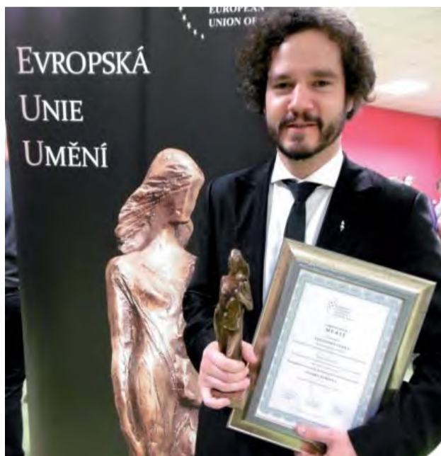
Zbor The Gospel Family získal významné ocenenie.

Európska únia umenia (EUU) je medzinárodným spoločenstvom umelecky a kultúrne aktívnych osôb. Od