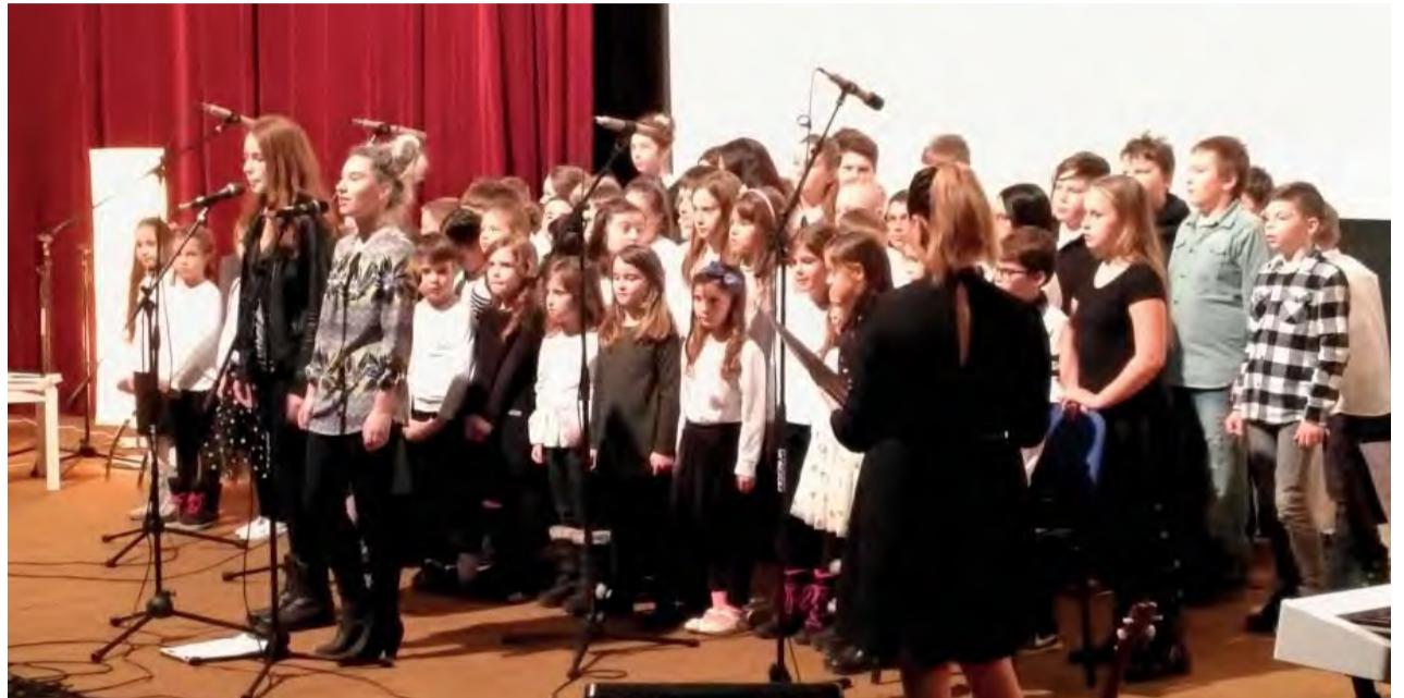
Výročný koncert SZUŠ sa naozaj vydaril.