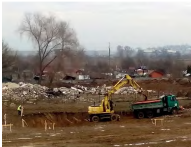
Začali sa výkopové práce na letnom kúpalisku.

V predchádzajúcom čísle Novodubnických zvestí sme informovali o zámere mesta vybudovať letné kúpalisko, a naše kroky s týmto zámerom sa posunuli ďalej.