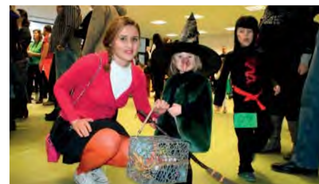
Množstvo krásnych masiek si prišlo zasúfažiť a zabaviť sa.