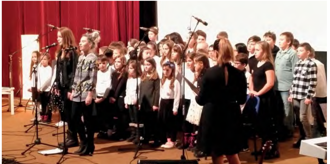
Výročný koncert SZUŠ sa naozaj vydaril.