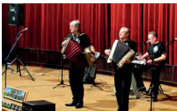
Na konci januára sa Novodubničania výborne zabavili s Veselou trojkou.