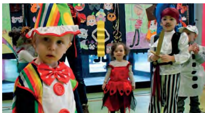
Porota to mala tento rok naozaj ťažké, aby vybrala tú najkrajšiu masku.