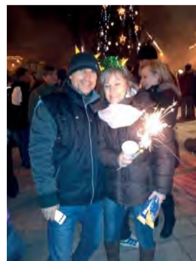
Silvestrovská zábava sa skončila až v skorých ranných hodinách.