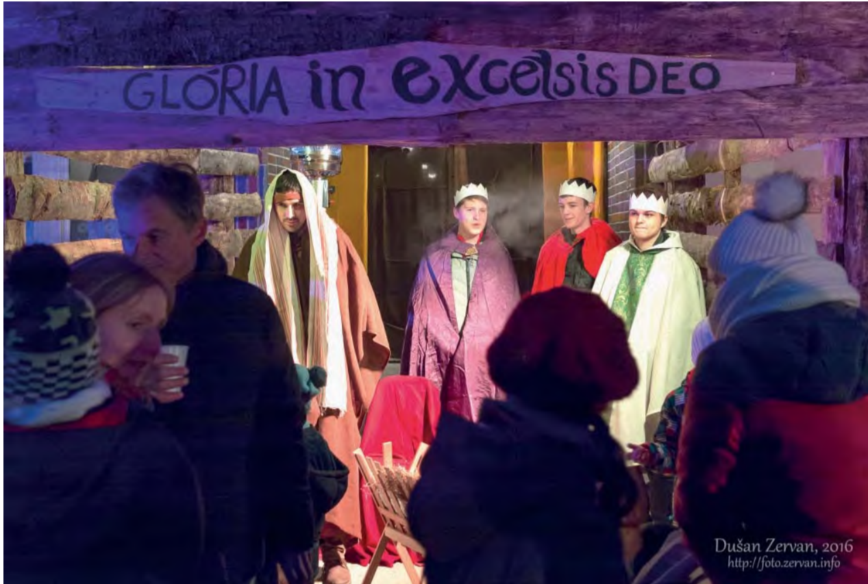
Pokloniť sa Jezuliatku prišli aj traja kráľi.

V Spojenej škole sv. Jána Bosca v adventnom období po prvýkrát pre širokú verejnosť usporiadali podujatie Živý betlehem.