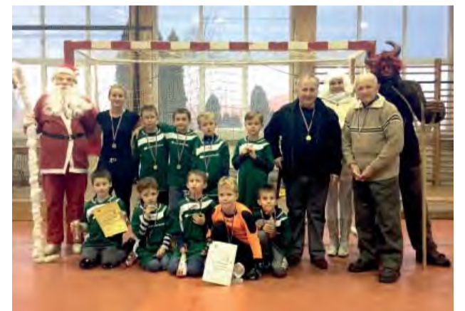
Mladých futbalistov potešil Mikuláš a sladké dobroty.