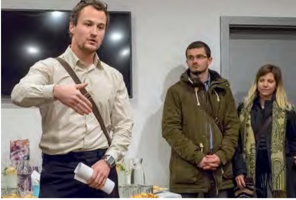
Vtípny a zaujímavý príhovor autora.