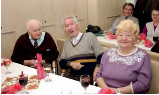
Aj po minulé roky sme sa na Silvestra v Klube dôchodcov dobre bavili.

Stalo sa už tradíciou, že členovia Združenia Klubu dôchodcov sa stretli a spoločne oslávili Silvestra 2018 a príchod Nového roka 2019.