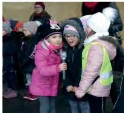
Už sa tešíme... Škólkári na skúške.