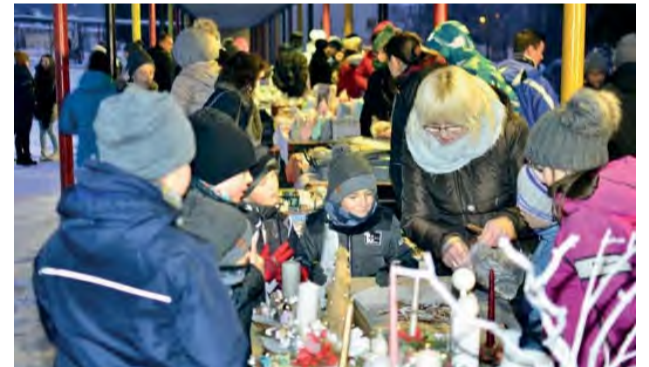
Súčasnou akcie boli aj vianočné predajné trhy.

Ježiška z maštalky – tisíckrát stvárnený, a predsa sa k nemu každý rok vraciame. Okrem Panny Márie, Jozefa, malého Ježiška, pastierov, nechýbali traja kráľi, koledníci a zbor anjelov. Prichádzajúci si vypočuli biblický text a v uponáhlanom predvianočnom čase sa v tretí adventný týždeň na chvíľku zastavili, stišli. Ani tento rok nechýbali živé zvieratká, ktoré už tradične zaujali tých najmenších. Celé popoludnie