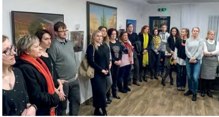
Na výstavu prišli aj pricestovalí Šťastného bývalí spolužiaci z gymnázia.