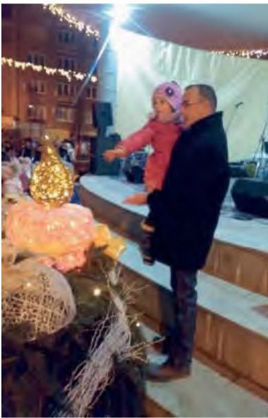
Host večera M. Karell zapálil tretiu adventnú sviečku.