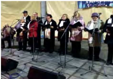
Folklorná skupina Teplanka si pripravila vianočné pásmo.