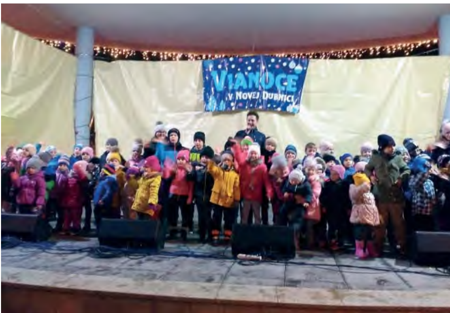
Záver adventných stretnutí patril deťom.