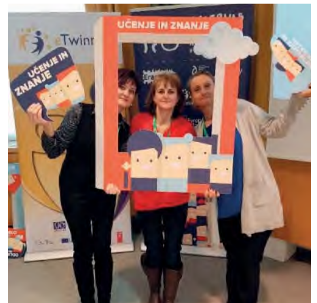
Fotografia z odborného seminára v Lublane v rámci praktických cvičení.