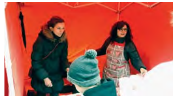
Vianočnú kapustnicu podávali milé manželky primátora a zástupcu primátora.