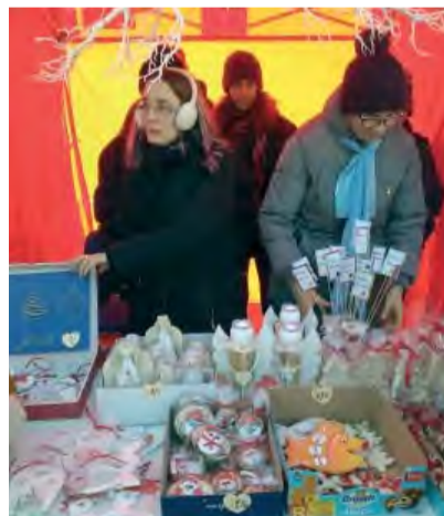
Darčeky pripravili aj mladí ľudia zo združenia Slnéčnice.