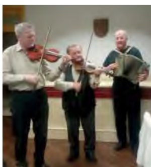
Interná kapela JDS.

Dňa 28. 12. 2018 sa 97 členov našej ZO JDS stretlo v Kultúrnej besede, pre nás na netradičnej „Štefanskej zábave“, pretože tento rok „Silvestrovská zábava“, pripadla na seniorov Klubu dôchodcov.