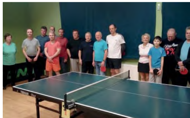
Účastníci stolnotenisového turnaja.