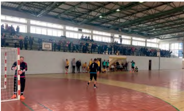
Zimného halového futbalového turnaja sa zúčastnilo 16 družstiev.

Tak ako každoročne, aj tento rok sa konal v termíne 12. - 13. januára 2019 Zimný halový futbalový turnaj v priestoroch mestskej športovej haly.