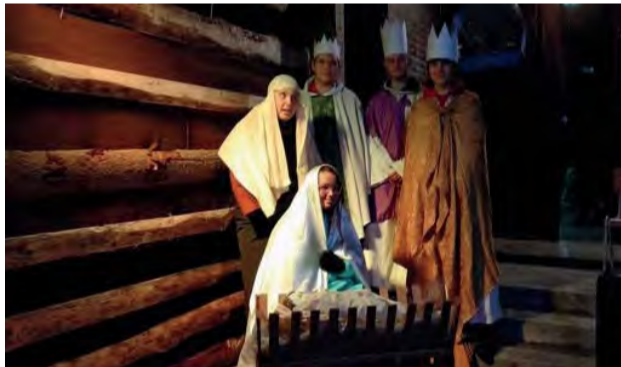
Živý Betlehem v Spojenej škole.

Vo štvrtok 20. decembra 2018 v areáli Spojenej školy sv. Jána Bosca už po tretíkrát ožil biblický príbeh „Živý Betlehem“, ktorý sa už tradične teší mimoriadnej obľube hostí a na toto nádherné podujatie sa prišli pozrieť návštevníci všetkých vekových kategórií zo širokého okolia trencianskeho regiónu.