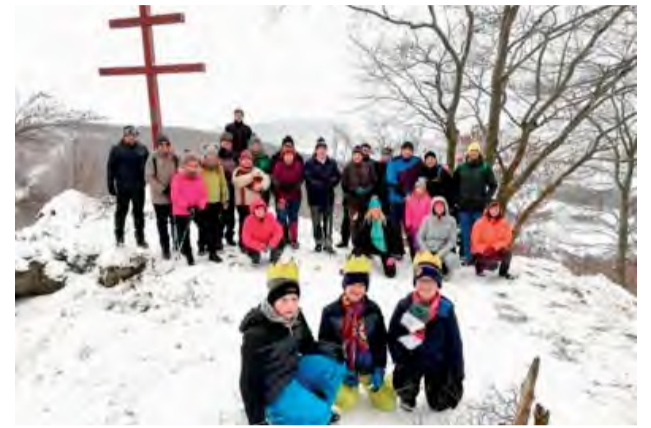
Účastníci KST Kolačín na Markovici.

Klub slovenských turistov Kolačín každoročne organizuje na začiatku nového kalendárneho roka Trojkráľový výstup na Markovicu. Tento rok si podujatie označenie „zimný výstup“ naozaj zaslúžilo, pretože snehová prikrývka, ktorá vytvára tú pravú zimnú atmosféru, bola naozaj štedrá.