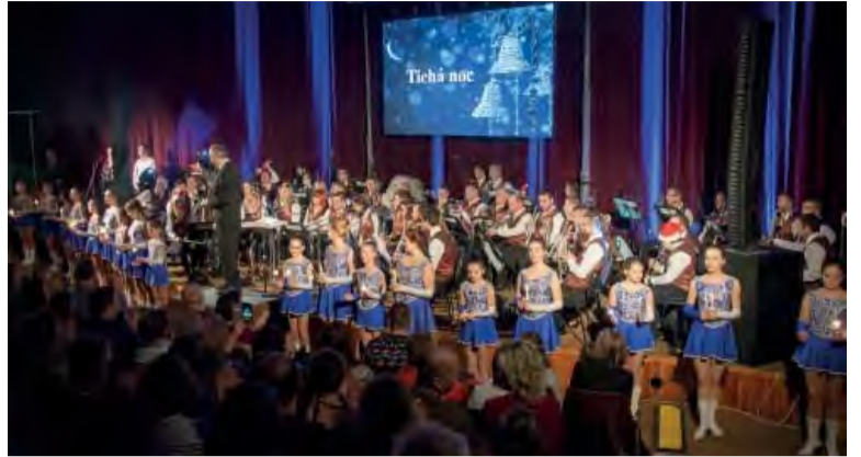
Grandiózny záver a tradičná Tichá noc.