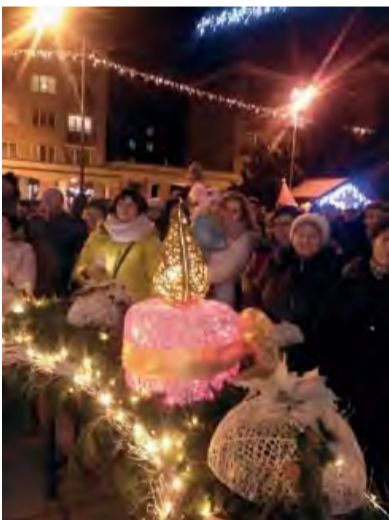
Slávnostná vianočná atmosféra na Mierovom námestí.