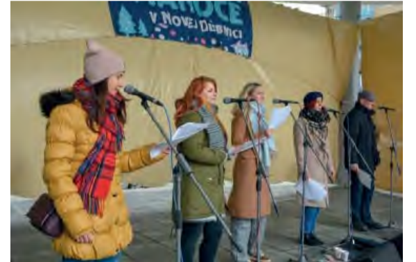
Štedrý deň si na Mierovom námestí bez Božieho šramotu nevieme predstaviť.