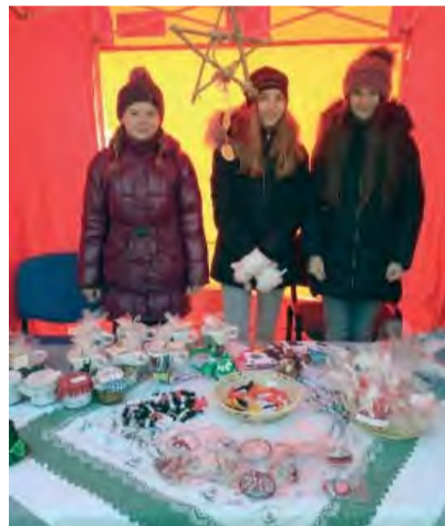
SZŠ ponúkala aj sušené jablčka a orechy v mede.