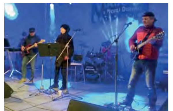
Výborná skupina NANOVO roztancovala Mierovom námestí.