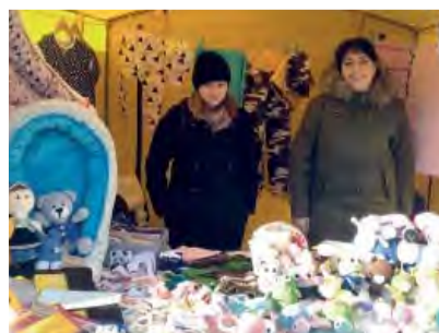
„Na vaše vianočné trhy sa tešíme... o rok sme tu znova“.