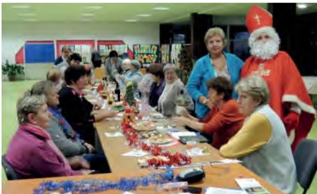
Pohľad na posedenie členiek ZO ÚŽS medzi ktoré zavítal Mikuláš.

Vianočný stromček, sviatočná výzdoba a stoly plné dobrôt. To všetko pripravil pre svoje členky výbor ZO Únie žien Slovenska v Novej Dubnici.