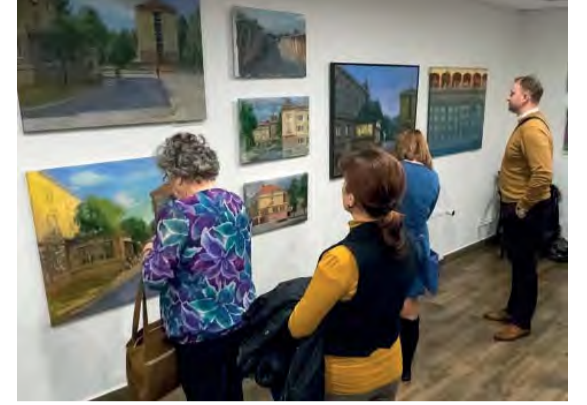
Na obrazoch ožívajú zákutia mesta. Dominuje v nich Krohova architektúra a život obyvateľov.