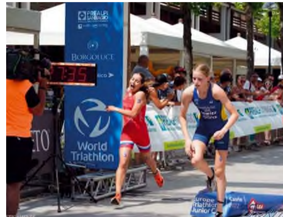
Európsky pohár Caorle.

Bez tlaku na výsledok, iba pre dobrý pocit sa postavila na štart majstrovstiev Európy v triatlone dorastencov (do 17 rokov) vo francúzskom La Baule a bolo z toho 6. miesto. Posledné preteky sezóny absolvovala v španielskom Bilbao a boli to majstrovstvá Európy v akvatlone (plávanie-beh). So sezónou sa rozlúčila najlepšie ako mohla. Získa-