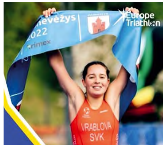
Európsky pohár Pañevėžys (foto: Europe triathlon).

la titul juniorskej majsterky Európy a v elitnej kategórii skončila na druhom mieste.