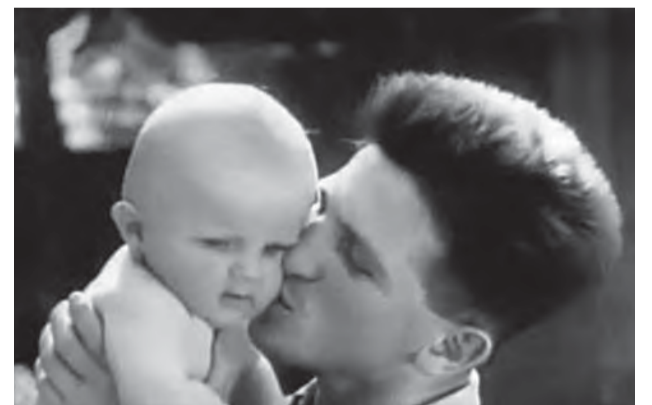
Nielen skvelý a úspešný športovec, ale aj pozorný otec a manžel.