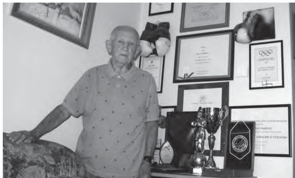
Množstvo trofejí a ocenení úspešného športovca Janka Zacharu.