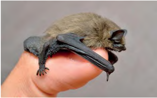
Nesympatický ale užitočný sused.

Tento týždeň obyvatelia, vchodu č. 17/1 v Sadoch Cyrila a Metoda mali zoologickú záhradu priamo v dome – do vchodu im totiž vletelo a udomácnilo sa niekoľko desiatok netopierov – druh večernica malá (po latinsky Pipistrellus pipistrellus ).