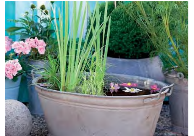
Smäd trápi aj zvieratá, budme k nim ohľaduplní.

Jedným z problémov, ktoré spôsobuje človek zvieratám, je nedostatok otvorených vodných plôch v zastavanom území miest. A živočíšni obyvatelia miest, ktorých si takmer nevšímame - čo je škoda - sa trápia smädom.