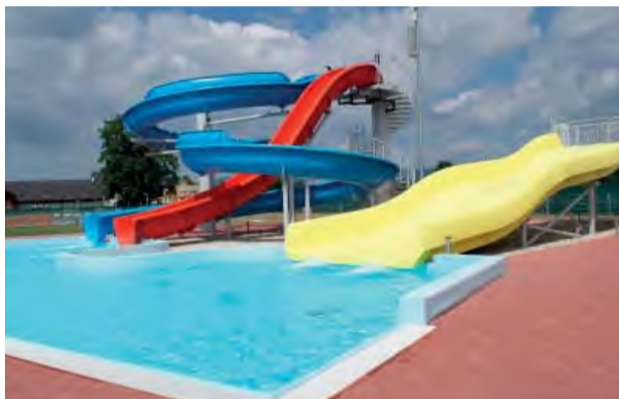
Najobľúbenejšia atrakcia letného kúpaliska - tobogany.