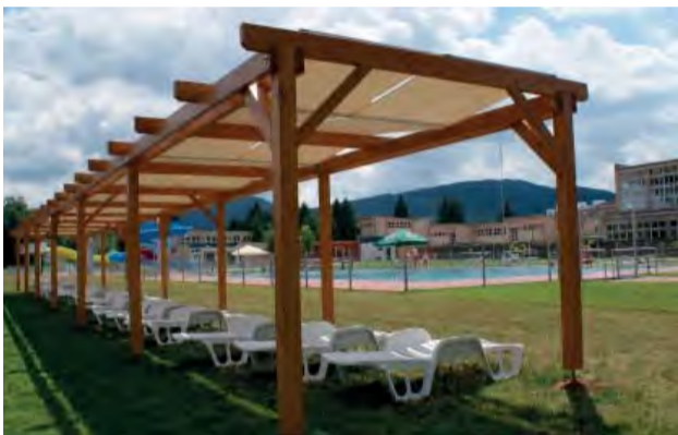
Na Letke pribudlo vkusné tienidlo na ležadlá.

Od 3. júla máme v Novej Dubnici opäť o dôvod na radosť viac. V horúce letné dni (ale aj tie menej horúce) sa každý môže od 10.00 do 18.30 osviežiť na letnom kúpalisku Letka. K tradičným letným aktivitám vo vode, či mimo nej pribudlo aj niekoľko novinek, ako je 50 plážových ležadiel, z ktorých 18 je pod prístreškom, pre tých menej „slnka chtivých“, alebo nový kút pre fajčiarov, keďže v celom areáli je zakázané fajčiť. Takže stiahneme bruchá, vypneme hrude a podme všetci k vode.