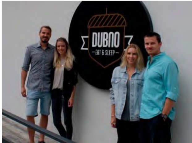
Dve rodiny, jedna reštaurácia. Dubno v Novej Dubnici.

Kolko trvá cesta z Novej Dubnice do Dubna? Ani nie zopár minút, a nie je to vtip. Ako isto mnohí Novodubničania vedia, od 1. mája je na gastronomickom poli v našom meste „nový hráč“,