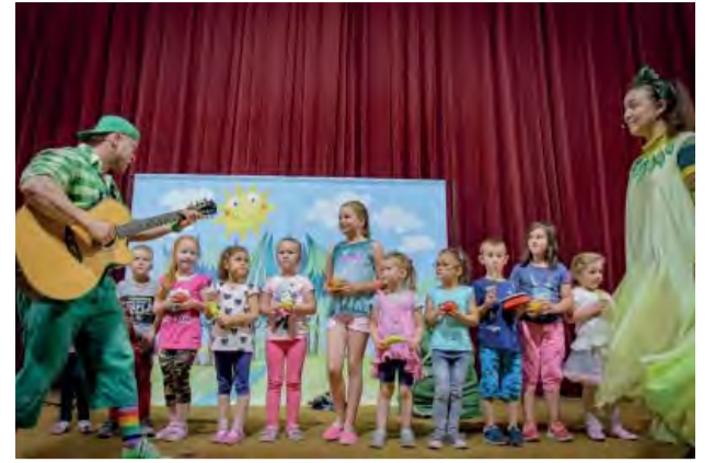
Novodubnícké deti potešil v Panorexe Zahrajko.