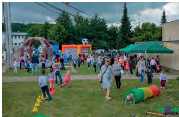
Kto prišiel na Jánskeho haluškový festival, rozhodne neofutoval.

Organizátori 11. ročníka Jánskeho haluškového festivalu, členovia Klubu slovenských turistov Kolačín si okrem iného želali na sobotu 23. júna pekné počasie, ktoré je vždy prísľubom príjemne stráveného dňa. Hoci ortuť na teplomeri stúpala veľmi pomaly a slniečko sa schovávalo čoraz viac, prišlo do priestorov v okolí Kultúrneho domu Kolačín viac ako tisícpäťsto návštevníkov, aby sa predovšetkým dobre najedli, osviežili a zabavili v spoločnosti svojich pri-