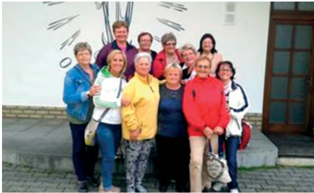
Členky klubu Venuša.

Všetky aktivity, ktoré posilňujú ducha chorého človeka, treba akceptovať, využívať a podriaďovať sa tomu, čo nás utužuje a dáva nádej do budúcnosti. To sviatime aj my, členky Klubu Venuša, ženy po prekonaní onkologického ochorenia v Novej Dubnici.