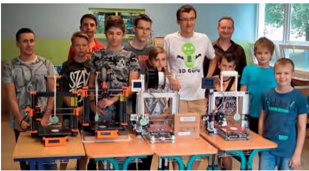
Netradičný súboj sa zaobíšiel bez zranení.

V stredu 27. 6. 2018 sa v priestoroch Súkromnej základnej školy v Novej Dubnici uskutočnil súboj 3D tlačiarňí spojený s workshopom "3D Guru Makes It".