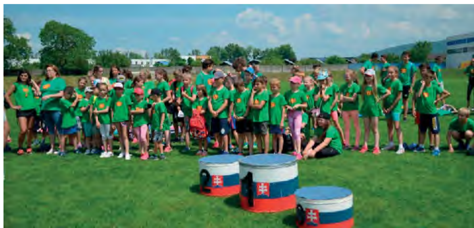
Úspešní atléti z atletického mítingu zo Základnej školy na Ul. Janka Kráľa.

S potešením sme bilancovali športové výsledky za školský rok 2017/2018 v Základnej škole na Ulici Janka Kráľa.