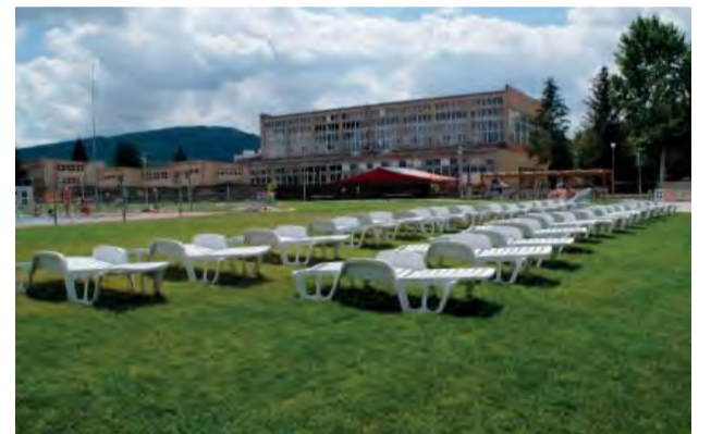
Ležadiel je dostatok pre všetkých.