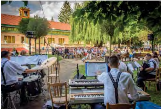
Prijemné nedeľné popoludnie s Duom Vente v Kultúrnej Besede.