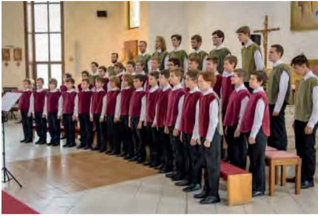
Bratislavský chlapčenský zbor vystupoval v kostole.