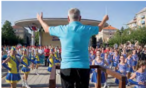
Počas záverečného monster koncertu sa predstavilo takmer 500 účinkujúcich.