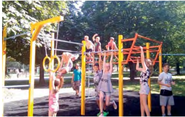
Nové ihriská sa tešia veľkému záujmu.

Zdravý životný štýl a pestovanie tela je trendom dnešnej doby a vyznávajú ho aj mnohí Novodubničania. Na ich podnet vyčlenilo mesto peniažky na dobudovanie tohto typu ihriska v Sade Duklianskych hrdinov (za Tescom) a spoločnými silami boli zvolené aj jednotlivé prvky a zostava na cvičenie.