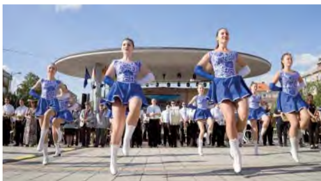
Novodubnické mažoretky v plnej kráse.