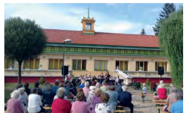
V nedeľu 14. júla sa konal koncert DH Chabovienka z Hornej Súče. Pestrý výber skladieb a piesní kapely priniesol našim občanom pekný kultúrny zážitok a prispel k príjemne strávenému nedeľnému popoludniu.