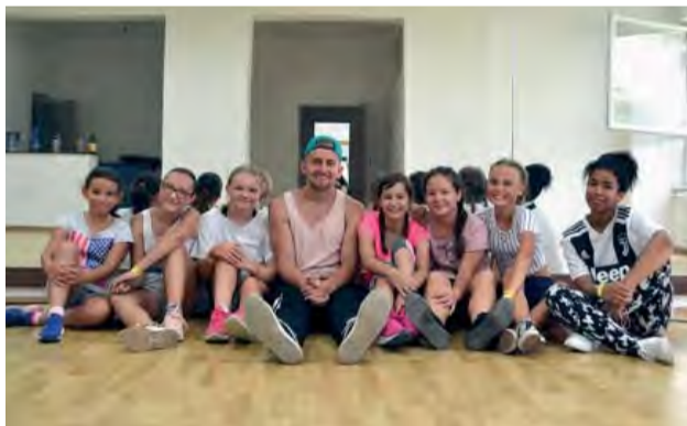
Tanec ich baví i počas prázdnin.

Cesta Tanečníka - taký majú názov tanečné tábory v Novej Dubnici a v Púchove, pod vedením tanečnej školy LT - Len Tanec.