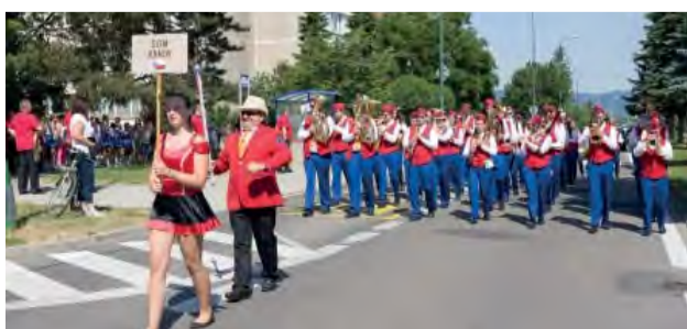
Sobotňajší program začínal sprievodom zúčastnených súborov.