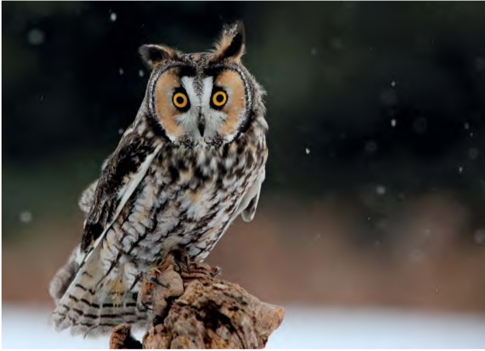
Myšiarka ušatá - druh sovy, ktorý často využíva na hniezdenie aj mestá.

Tento článok vznikol na základe podnetu od obyvateľa mesta, ktorý navrhol: „Dobrý deň, mal by som pre Vás námet do nového čísla Novodubnických zvestí. Bývam na Trenčianskej 726 a v tomto kalendárnom roku je v nočných hodinách (po 22.00 h) počuť špecifický piskot nejakého vtáka na celé okolie. Na internete sa mi podarilo dohľadať a zrejme ide o kuvika. Rád by som sa dozvedel o tomto dravcovi nové informácie (v čom je prospešný) a či napríklad nehrozí jeho premnoženie v Novej Dubnici. Nakolko z jedného nočného piskotu v okolí Súkromnej základnej školy sa ich stalo viacero už aj v ulici Pod Bôrikom.“