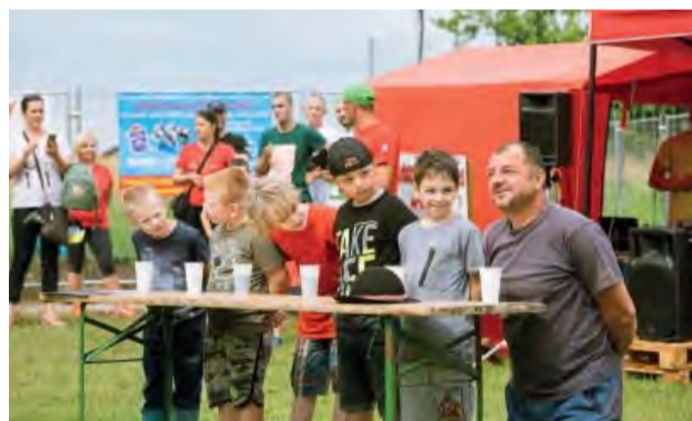
Po daždi pokračoval Jánsky haluškový festival súťažami.

Organizátori 12. ročníka Jánskeho haluškového festivalu, členovia Klubu slovenských turistov Kolačín v spolupráci s mestom Nová Dubnica, sa na sobotu 22. júna pripravovali už niekoľko týždňov vopred.