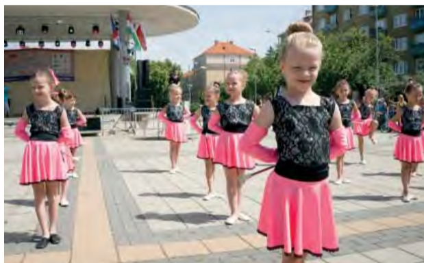
Najviac priazne sa ušlo mažoretkám, a špeciálne najmladším vekovým kategóriám.