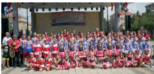
Na náš orchester a mažoretky sme právom pyšní!