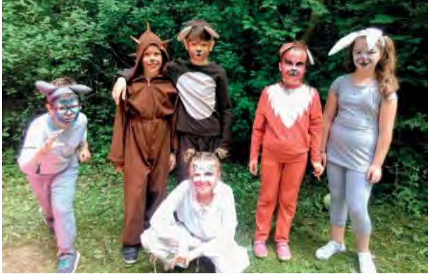
Aj takéto milé zvieratká sme mohli stretnúť v našom lese.

Opäť po roku CVČ zorganizovalo pre širokú verejnosť mesta Nová Dubnica podujatie Cesta rozprávkovým lesom.