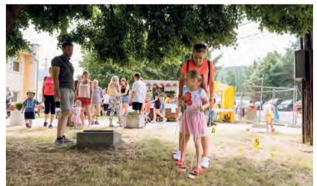
Pre najmenších boli pripravené viaceré zábavné stanovišťa.

Tí, ktorí prišli bez detí, smerovali k niektorému zo stánkov s občerstvením. Všetci sa však tešili najmä na vynikajúce slovenské halušky alebo guláš. Čapovalo sa pivo Svijany i ko-