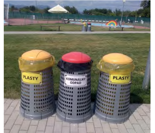
Odpad musíme triediť aj na kúpalisku! K dispozícii je množstvo nádob označených príslušnými nápismi.

Tak trochu náhodou som bola skontrolovať vrecia s odpadom, ktoré sa odvážajú z letného kúpaliska Letka a s ním úžasom som musela skonštatovať dve veci: „Na kúpalisku v sezóne najmenej môjho odpadu“ a „Na kúpalisku sa naozaj dosť zle triedi odpad“.