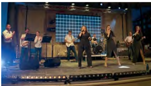
Festival bez novodubnickej skupiny Boží šramot si už nevieme predstaviť - ich koncert roztancoval celé námestie.