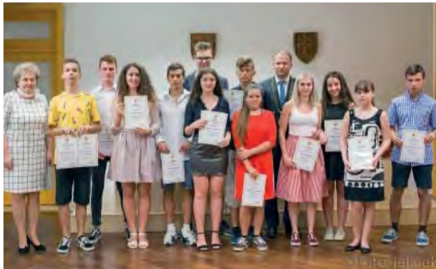
Ocenení žiaci - nech sa vám darí aj naďalej!

Dňa 26. 6. 2019 sa uskutočnilo oceňovanie najlepších žiakov školských zariadení nášho mesta za výborné výchovno-vyučovacie výsledky, úspechy na súťažiach a vzornú reprezentáciu školy a mesta Nová Dubnica v školskom roku 2018/2019.