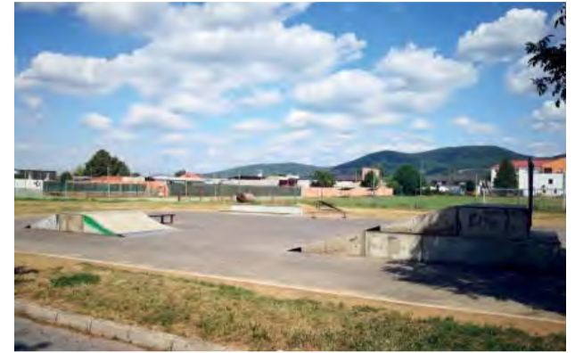
Skejť si po novom vychutnáte pri futbalovom štadióne.

Už počas niekoľkých dní od osadenia prvkov sa ukázalo,