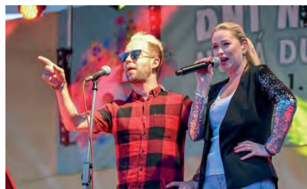
Skvelá interpretácia tých najlepších hitov v podaní Happyband Orchestra.