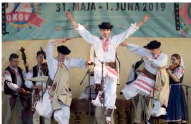
Dych vyrážajúce vystúpenie dubnického folklórneho súboru Vršatec.