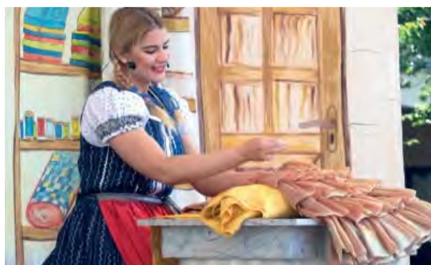
Divadlo pod balkónom odohralo rozprávku Krajčír Nitôčka.