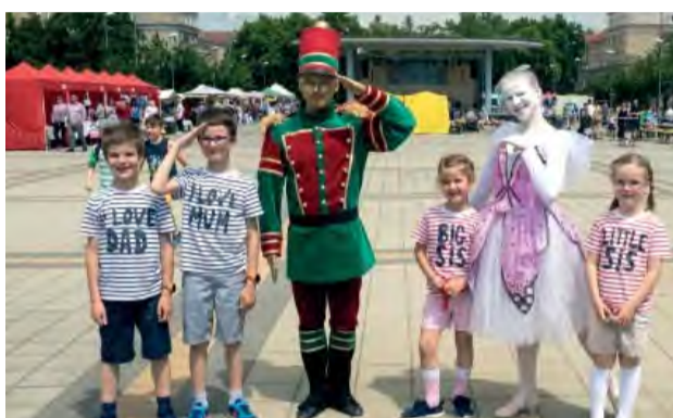
Stretnutie so živým cínovým vojačikom a jeho baletkou bol príjemným prekvapením najmä pre deti.