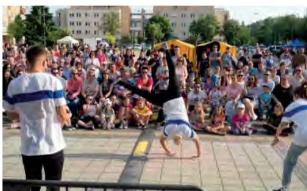
Nie Len Tanec, ale aj veľa dobrej nálady priniesla so sebou táto tanečná škola.