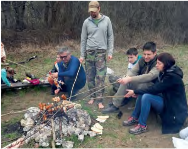
Nech sú naše opekačky príjemnými stretnutiami bez negatívnych vplyvov a ohrození pre ľudí či prírodu.

„Dobrý deň, chcem Vás poprosiť, či viete zistiť, kde sa dá u nás legálne opekať na vyhranenom ohnisku a prípadne, či nie je ešte v platnosti nejaká ochrana a zavesiť to na FB, lebo dosť ľudí sa ma na to pýta a ja tiež neviem – predpokladám, že v areáli zdravia to možné je, ale či neplatí práve zákaz zakladania ohňa? Viem, že kedysi bývalo ohnisko na Dubovci, v areáli zdravia, pri salaši, prípadne v Kolačine... Ďakujem D.“