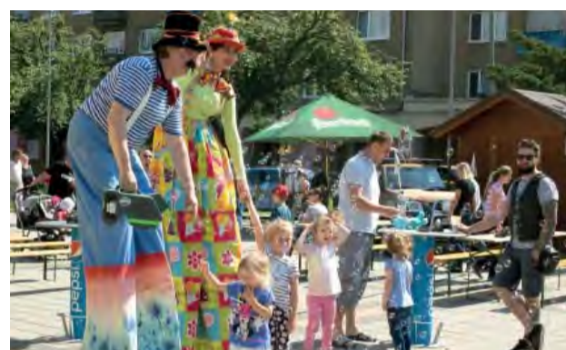
Neprehliadnuteľní chodúľoví klauni naplnili námestie bublinkami a detskými úsmevmi.