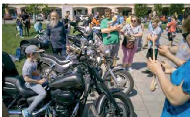
Svoje tátoše prezentovali a záujemcov povozili motorkári z Novej Dubnice aj okolia.