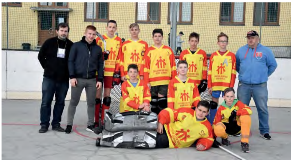
Dôležitá je radosť z hry v duchu fair play.

Organizátori saleziáni so svojimi partnermi ponúkajú okrem ihrísk voľný vstup pre každého nadšenca dobrého zápasu a tento rok privítali nadaných športovcov do pätnást rokov zo siedmich tímov z celého Slovenska.