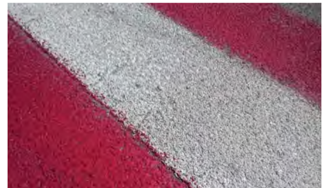
Nové priechody s protišmykovou úpravou sa stretli s priaznivým ohlasom u občanov.

V júni mesto zrealizovalo protišmykové úpravy na 17. jestvujúcich červeno-bielych priechodoch pre chodcov.