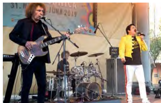
Hviezdou piatkového večera bola skupina Queenmania s vynikajúcimi novodubnickými hudobníkmi.