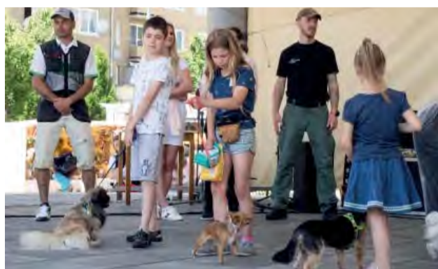
Ukážka milej symbiózy detí a ich psíkov v súťaži Naj psík Novej Dubnice.