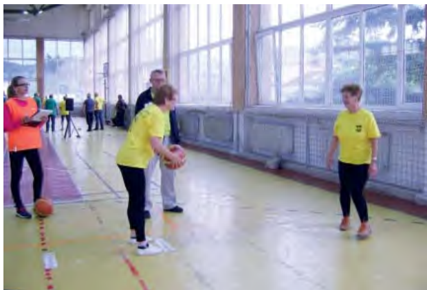
Radosť zo športových hier nepokazilo ani nepriaznivé počasie a seniori podali skvelé výkony.

V dňoch 22. - 23. 5. 2019 sa naši seniori zúčastnili dvoch veľkých akcií. V stredu 22. 5. sa v Novej Dubnici uskutočnili 13. okresné športové hry seniorov JDS.