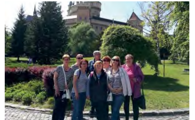
Relaxačný pobyt vďaka dotácii mesta.

Na členskej schôdzi Klubu Venuša padla otázka, kam naplánovať relaxačný pobyt. Do ktorého zariadenia či kúpeľov, aby bol každý z členov spokojný? To je vždy to najťažšie! Prišiel návrh, že by to tentoraz mohlo byť kúpeľné mesto Bojnice.