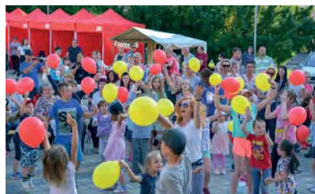
Završenie programu pre deti - vypustenie balónikov vo farbách mesta.