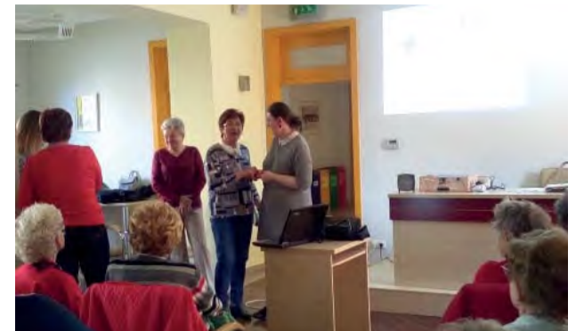
Seniori diskutovali s lekárkou.

Pred časom nás navštívili zdravotnícke pracovníčky za účelom preventívneho vyšetrenia z kvapky krvi a následne sme si v rámci Akadémie strieborného veku vypočuli odbornú zdravotnícku prednášku. Napriek tomu, že boli v plnom prúde práce na záhradkách, prišiel veľký počet členov načerpať nové vedomosti.