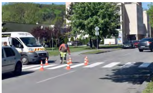
Na obnovu vodorovného značenia v meste je vyčlenených 20 tisíc eur. Práce by za priaznivého počasia mali skončiť do konca mája.