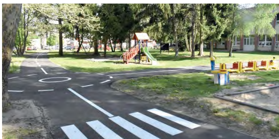
Na nové dopravné ihrisko pribudnú ku vodorovným aj zvislé dopravné značky pre malých účastníkov premávky.

Zameraním projektu je získavanie elementárnych kognitívnych vedomostí a nácvik praktických spôsobilostí detí predškolského veku v oblasti dopravnej výchovy a vzdelávania. Denne sme chtiac