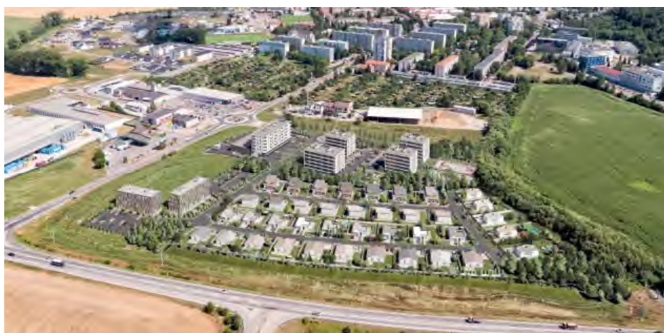
Vizualizácia budúcej obytnej zóny Hliny I.

Prvá etapa výstavby zahŕňa budovanie inžinierskych sietí, ciest a chodníkov, príprava pozemkov na individuálnu výstavbu rodinných domov a päťposchodový polyfunkčný dom. Okrem jedno až štvorizbových bytov s balkónmi, komôr, kočíkárni a technickej