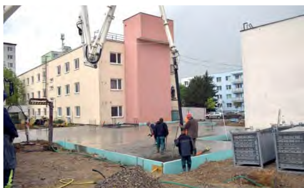
Hoci počasie práve neprialo, práce na novom zariadení pre seniorov pokračovali betonážou „deky“.