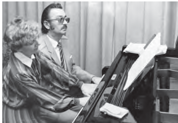
Manželia Kostrovci počas koncertného vystúpenia.

Základná umelecká škola v Novej Dubnici od svojej existencie spolupracuje s materskými, základnými a strednými školami v Novej Dubnici a v okolitých mestách. Pre širokú verejnosť sa od roku 1962 konajú „učiteľské koncerty“. Dodnes sa konajú verejné žiacke a absolventské koncerty, výstavy výtvarného odboru, výchovné koncerty pre materské a základné školy. Žiaci účinkujú aj na rôznych akciách, poriadanych školou i mestom.