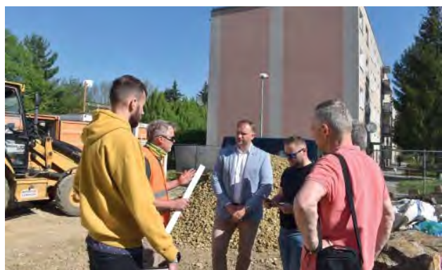
Na kontrolnom dni stavby sa stretávajú najmä zástupcovia zhotoviteľa, primátor mesta, pracovníci oddelenia výstavby MsÚ a vedúci stavby.