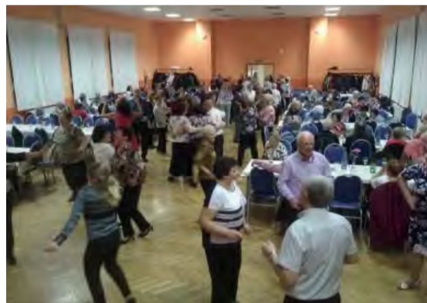
Nefalšovaná fašiangová zábava v Kolačine.

Jednotiaci si tohoročné fašiangy skutočne užívali. Po vydarenom vystúpení v mestskom fašiangovom sprievode besedovali v pondelok na Akadémii striebor-