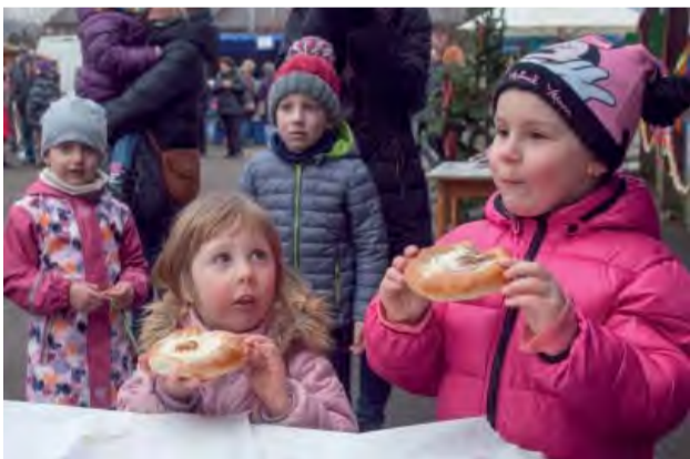
Súťaž v papkaní obľúbených teplanských koláčov.