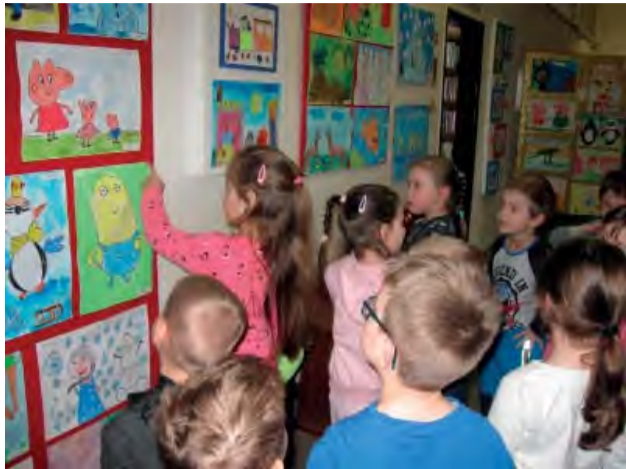
Knižnicu ovládli obľúbení rozprávkoví hrdinovia detí z MŠ Komenského sady.

„Hrdinovia v súčasnej rozprávke“ bol názov výtvarnej súťaže, ktorú vyhlásila mestská knižnica pre deti materských škôl v našom meste.