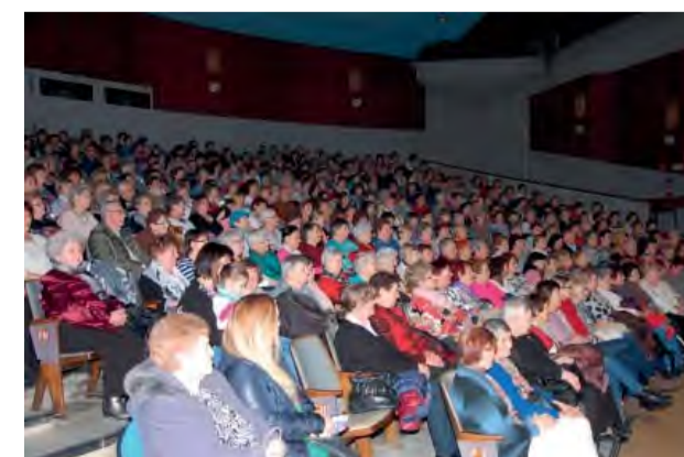
Aj tento rok bol Panorex plný žien.