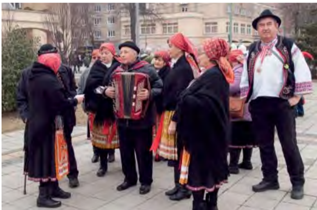
Folkloristi zo susednej Trenčianskej Teplej.