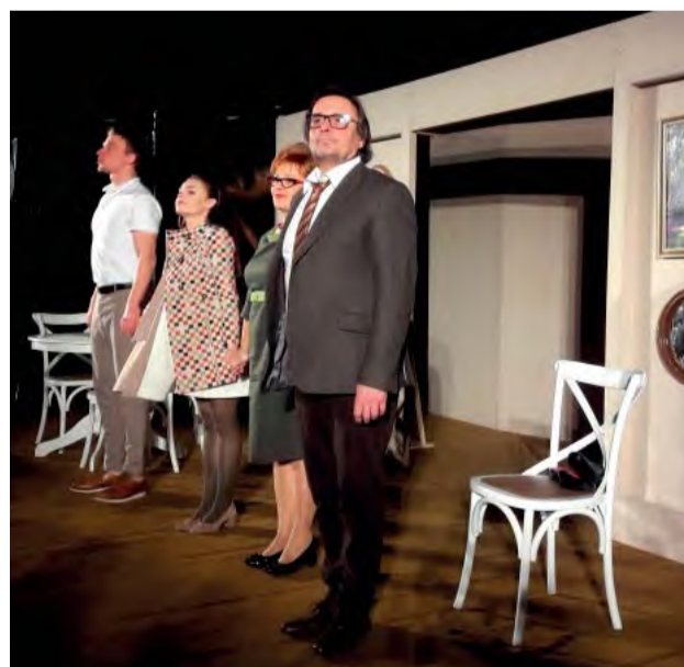
Záverečná klaňačka, ďakujeme za príjemný večer.

Panorex ponúklo svoje „dosky, ktoré znamenajú svet“ hercom z Bratislavy, ktorí 9. marca odohrali inscenáciu „Predstavím fa oteckovi“. Divadlo malo naozaj veľmi pozitívne ohlasy.