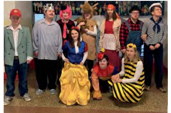
Slnečnice v karnevalových maskách.