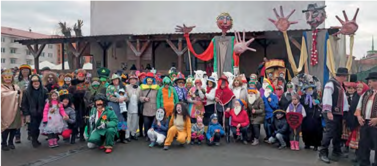
Fašiangový sprievod sa rozrástol... a o rok nás bude ešte viac.