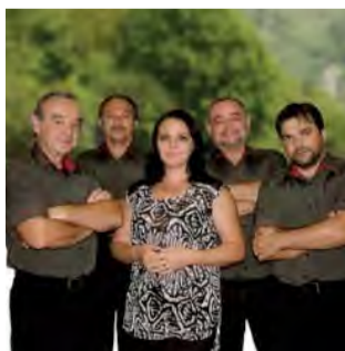
Hudobná skupina Akord

Predpredaj vstupeniiek a informácie: Oddelenie kultúry a športu MsÚ Nová Dubnica, Tel.: 042 4433 3484, kl. 110, 112, E-mail: kebiskova@novadubnica.sk, www.novadubnica.sk