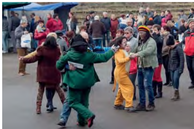
Úžasné novodubnické maskary vo víre tanca.