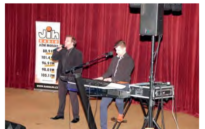
Ženy si s chuťou zaspievali nestárnuce šlágre Karla Gotta.