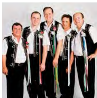
Hudobná skupina Profil