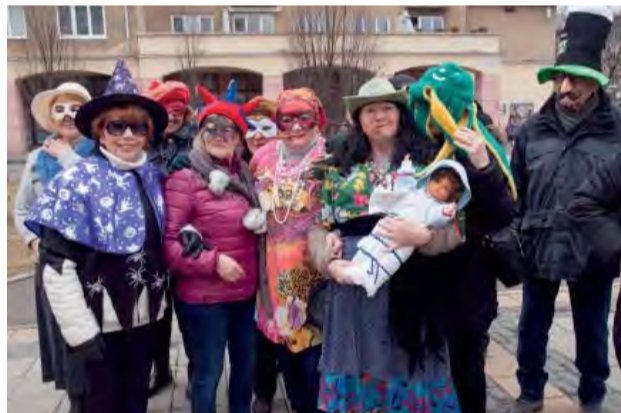
Vtipným a nápaditým maskám jednoznačne kraľovali tento rok seniori.