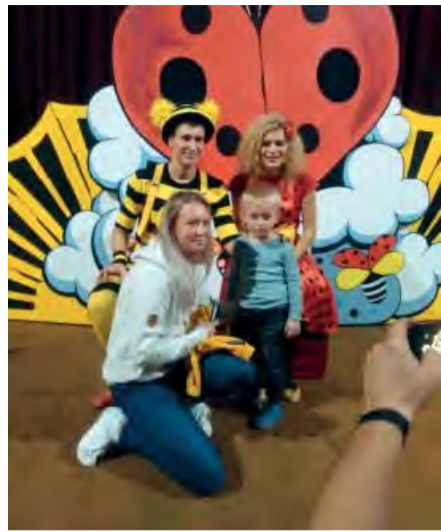
Záverečné fotenie s obľúbeným Smejkom a Tanculienkou si deti opäť užívali.