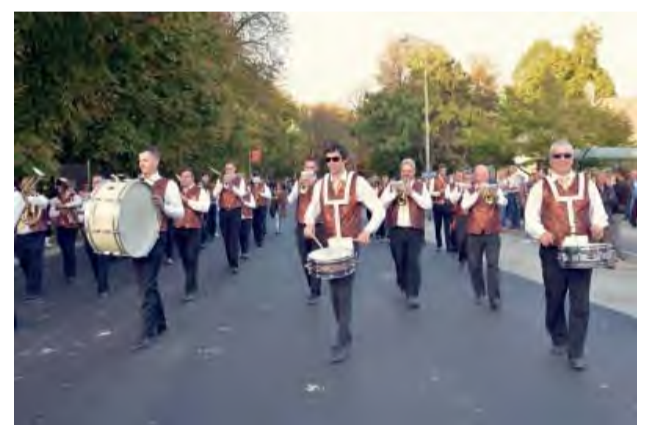
Sprievod mestom sprevádzalo slnečné počasie.