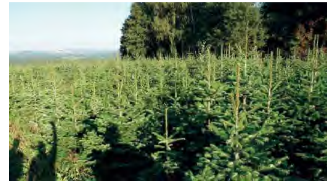
Takto sa pestujú aj vaše vianočné stromčeky. Ilustračné foto.

Dušíčky sú za nami a obchodné domy nám už niekoľko týždňov intenzívne ponúkajú informáciu, že sa blížila Vianoce. Poďme si teda posvietiť na najvýraznejší súčasný symbol Vianoc – vianočný stromček.