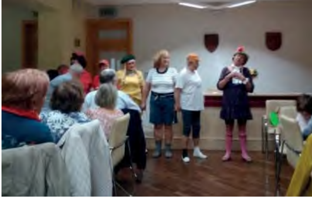
Kto povedal, že „starší“?!

Dňa 22. 10., v čase zvyčajných stretnutí, sa konala, ako každý rok v našej ZO JDS oslava Mesiaca úcty k starším.