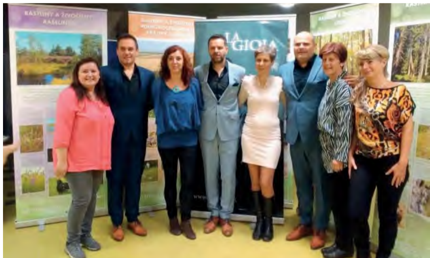
Koncert La Gioia si nenechali ujsť ani členky Amazoniek - OZ pre onkologické pacientky.