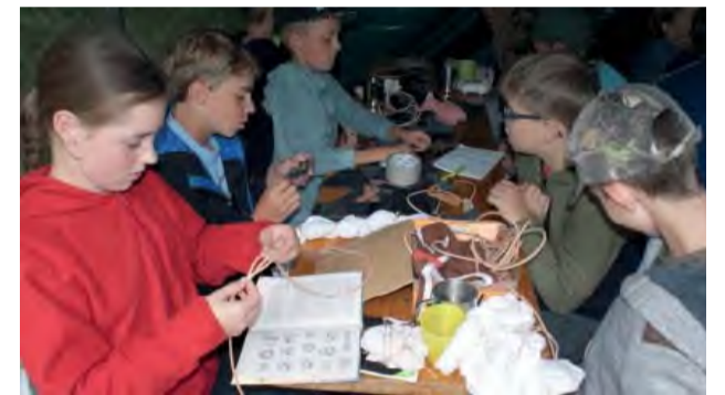
Aký by to bol skaut bez zručnosti vo viazaní uzlov?