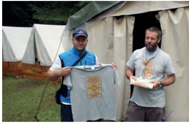
„Rimanom“ doplnil zásoby potravín aj primátor mesta.

Dokázate si v dnešnej modernej dobe predstaviť byť v lese desať dní bez elektriny, mobilu či internetu? Pre nás skautov to nie je nič zložité.