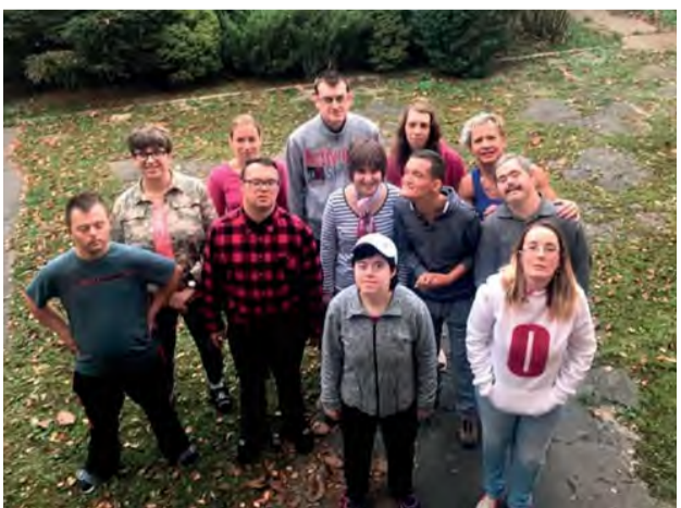
Slnéčnice? To sme predsa my!