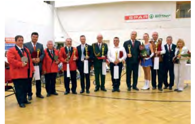
Zástupcovia zúčastnených orchestrov.