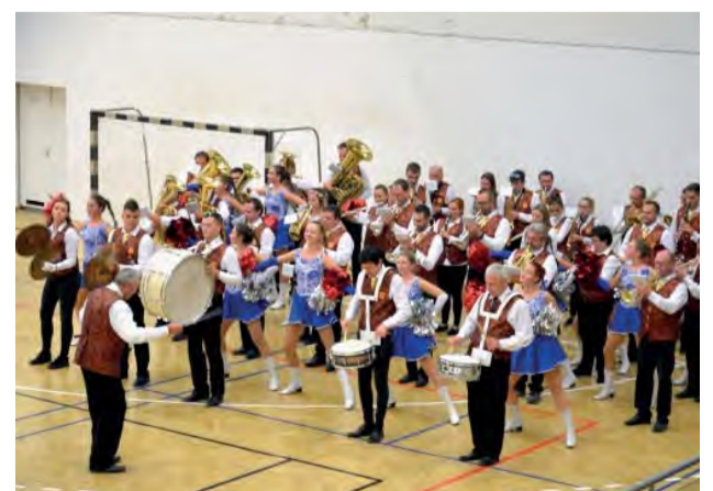
Náš orchester zožal veľký úspech.