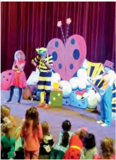
Predstavenie Smejka a Tanculienky.