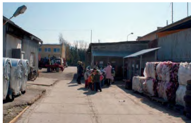
Zberný dvor je vám k dispozícii na ulici Topolovej.

7. Na zbernom dvore sa neodoberá zmesový komunálny odpad (ten patrí do kontajnera v mieste bydliska), preto je každý návštevník zberného dvora povinný doviezť odpady buď roztriedené na zložky, alebo pod dohľadom správcu