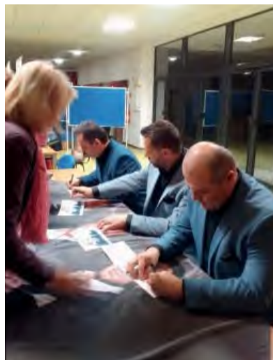
Speváci ochotne rozdávali svoje podpisy fanúšikom.