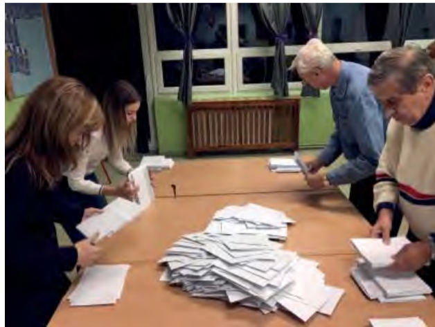
Členovia volebnej komisie volebného okrsku č. 6 sčítavajú hlasy.

Aj v Novej Dubnici sme si v sobotu, 10. novembra 2018 volili svojich zástupcov do orgánov samosprávy mesta.