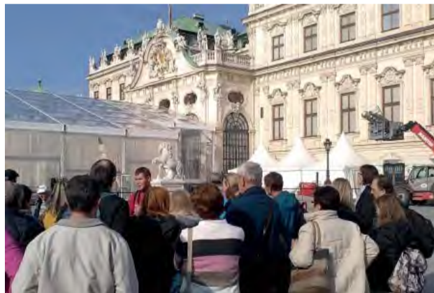
Účastníci výletu pred habsburským sídlom Belvedere.