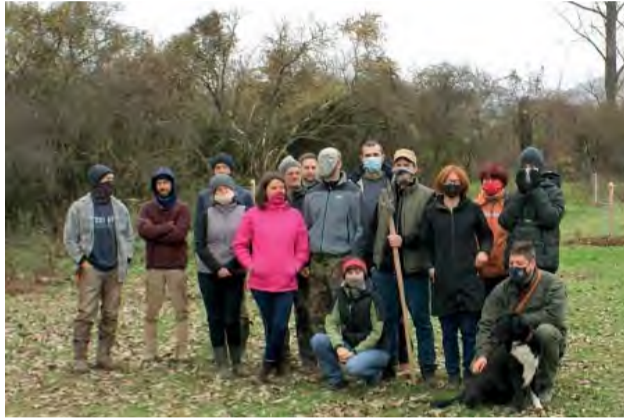
Hurá, sad je vysadený, veríme, že sa v ňom čoskoro znovu stretáme.