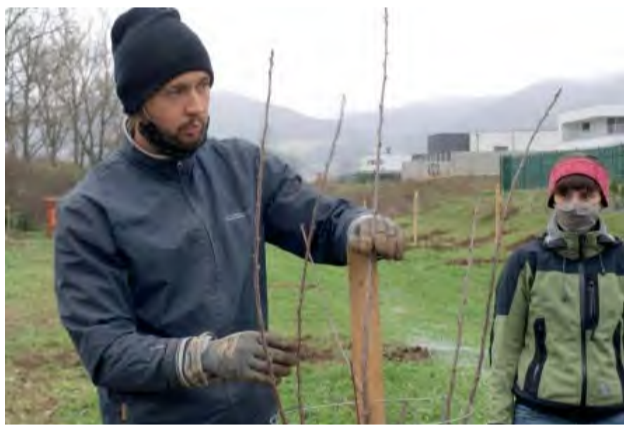
Dobrovoľníkov inštruovali a na výsadbu dozerali sadovníci zo združenia „Ovocný strom“.