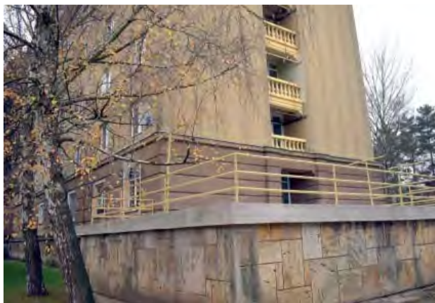
Terasa slobodárne po jej rekonštrukcii.

Po jednoročnej „pauze“ mesto opäť navrhlo a poslancé zbor odsúhlasil dotáciu pre Občianske združenie SORELA na obnovu Krohovej architektúry na objekte Slobodárne č. 18 v Sadoch Cyrila a Metoda.