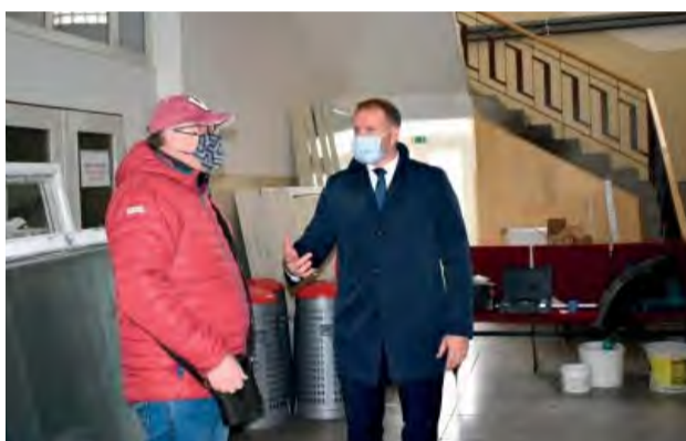
Primátor na kontrolnom dni stavby. Podľa jeho slov bude rekonštrukcia pokračovať aj v roku 2021.

V novembri prebehla výmena všetkých 83 okien za