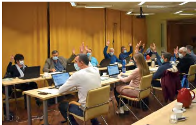
Mestskí poslanci počas novembrového zasadnutia MsZ.

Poslanci sa stretli na zasadnutí v Kultúrnej besede dňa 18. 11. 2020. Podľa zverejneného programu čakalo na prerokovanie šesťnásť bodov zastupiteľstva.