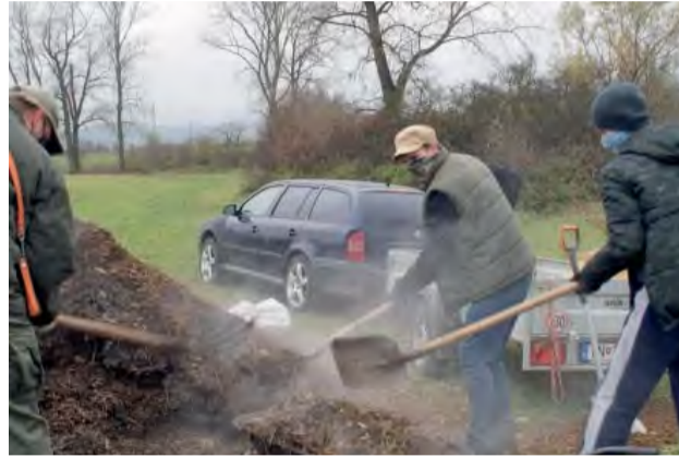
Pod nové dreviny bolo rozvezených približne 180 fúrikov konského hnoja a drevnej štiepky.