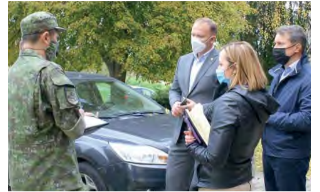
Vedenie mesta v spolupráci s armádou počas prípravy priestorov na testovanie.

Ani Novú Dubnicu neminuli dve kolá plošného testovania na ochorenie COVID19. Prebiehalo počas víkendov.