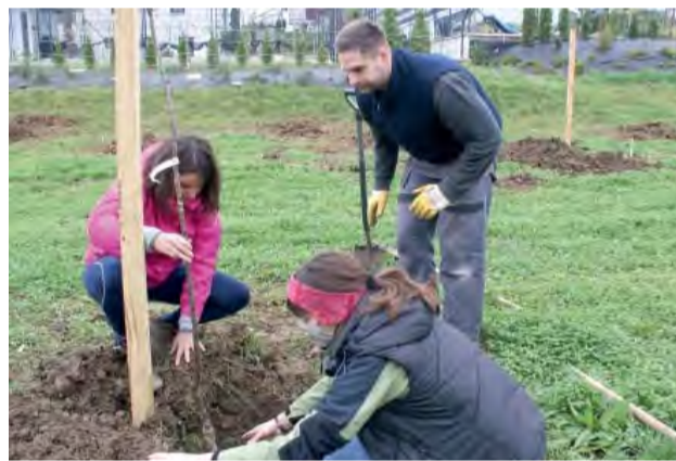
Od správneho vysadenia stromčeka záleží jeho ďalšie prosperovanie. Sadili sa staré odrody Bielych Karpát.

V novembri sa vysádzali ovocné stromy vo verejnom sade, ktorý bude slúžiť na oddych, vzdelanie a tiež príjemný čas strávený v prírode.