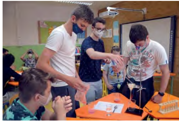
Chémia hrou - príprava DNA.

Český film o závislosti, ale i o vytváraní puta a o návratoch na dôverne známe miesta ma inšpiroval pri hľadaní názvu projektu, ktorý som začala realizovať v rámci ročného vzdelávacieho programu Komenského inštitútu.