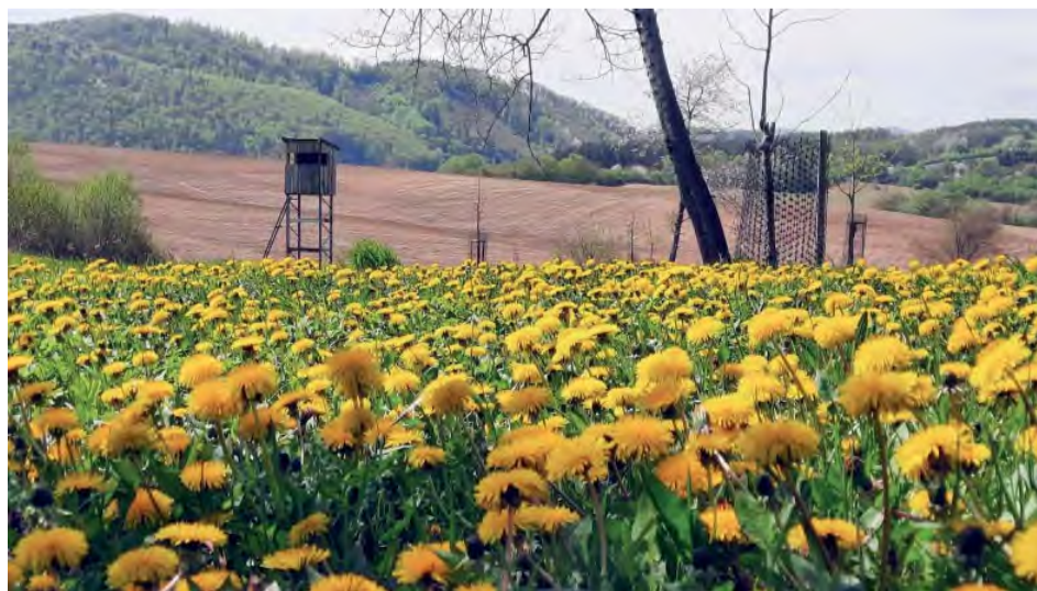
Volba primátora mesta - Púpavový rozkvet od Mareka Vrba.