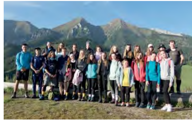
Výlet animátorov do Vysokých Tatier.

Teplé letné dni sú už dávno spomienkou a príroda sa už zaoďiala do pestrých farieb. Pestré bolo aj leto u saleziánskom stredisku v Novej Dubnici.