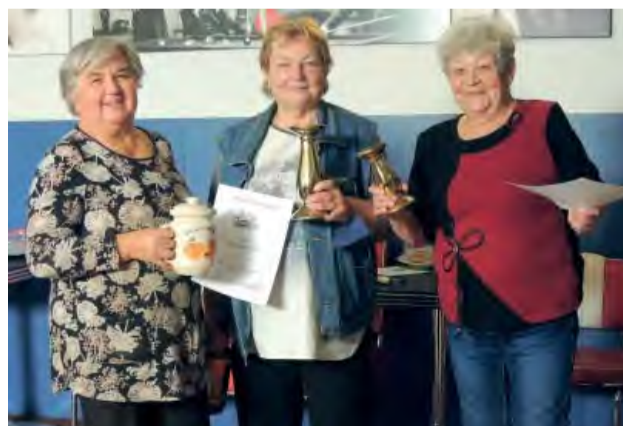
Spokojné víťazky bowlingového súboja.

Október je mesiac, kedy príroda hýri najkrajšími farbami jesene. Zároveň symbolizuje jeseň života. V mesiaci októbri si už takmer tri desaťročia pripomíname Mesiac úcty k starším, kedy si viac ako inokedy uctievame