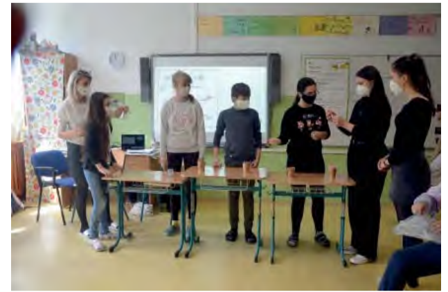
Aj o podnikaní sa dá učiť názorne a nápadito.

Dôležitou súčasťou projektu boli besedy o štúdiu na stredných školách v regióne. Hlavné slovo dostali študenti SOŠ IT v Novej Dubnici, SPŠ v Dubnici n/V, SZŠ v Trenčíne, gymnázií v Trenčíne, Dubnici n/V a bilingválneho gymnázia v Sučanoch, predovšetkým naši bývalí žiaci. Priniesli cenné „necenzúrované“ postrehy z prezenčného i dištančného vzdelávania. Nejednému de-