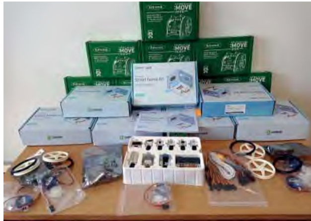
Mikro počítače získané zapojením sa do projektu Enter pomôžu rozvíjať deti nie len v oblasti programovania.

Každá škola, a zvlášť spojená, akou je tá naša, pripomína živý organizmus. Má svoje potreby, zvyky a robí všetko pre to, aby sa zdokonaľovala a mohla neustále ponúkať niečo nové, atraktívne.