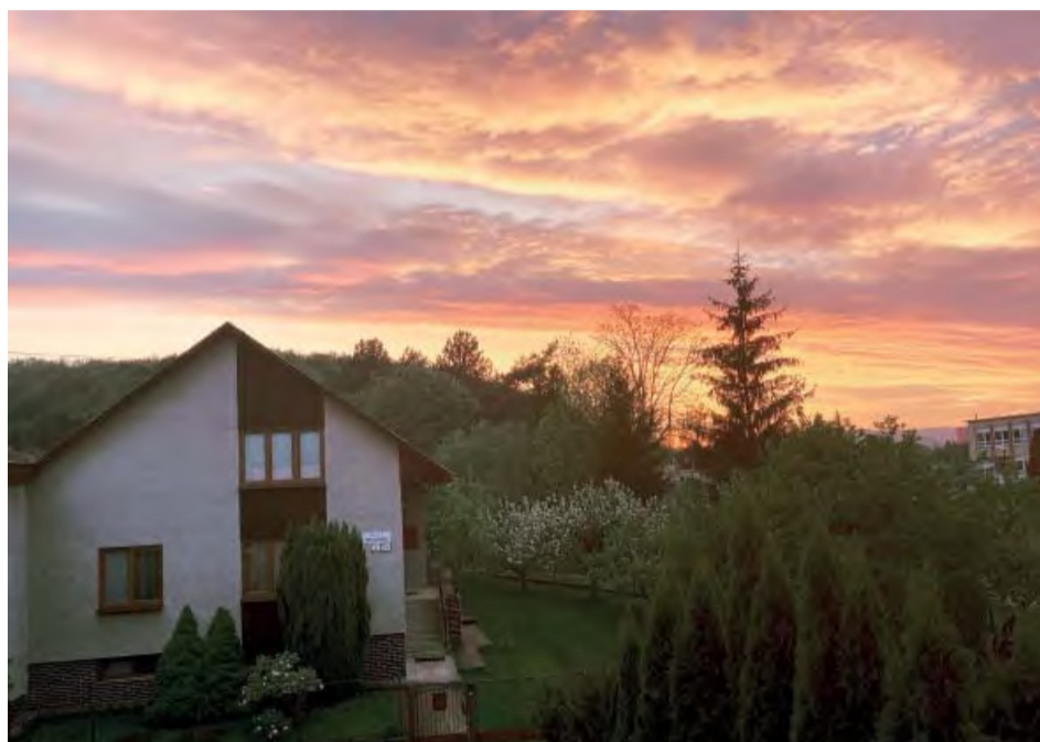
Hlasujúcim sa najviac páčila fotka Večerný výhľad od Richarda Klánka.

Blahoželáme, tešíme sa na vaše jesenné fotky, ktoré ste nám posielali do 30. novembra a aj na „rozuzlenie“ celoročnej súťaže, teda na jej vyhodnotenie a vyhlásenie víhercu hlavnej ceny.