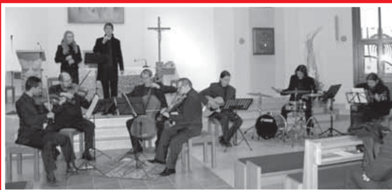
Laugaricio Quartet s prekvapujúcimi hosťami so speváčkami, gitarovou sekciou a bicími.