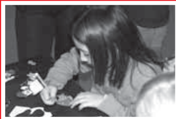
Všehochuť z Predvianočných tvorivých dielní.

Najštedrejšie sviatky roka sme lákali k nám aj v kine Panorex. Slávnostne ošatené foyer kina po roku opäť hostilo šikovných majstrov ručnej výroby. Vyrezávaný Betlehem, hviezdičky zo slamy, prírodné adventné venčeky, ozdôbky zo sadry, paličkovanej čipky, včelieho vosku, prútia a ďalších materiálov vytvárali dokonalú predvianočnú atmosféru. Vlastnoručne si vyrobiť alebo zakúpiť - také možnosti ponúkali Predvianočné tvorivé dielne všetkým návštevníkom.