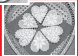
Vítazné medovníčky - najvoňavejšie, najchutnejšie, najkrajšie!